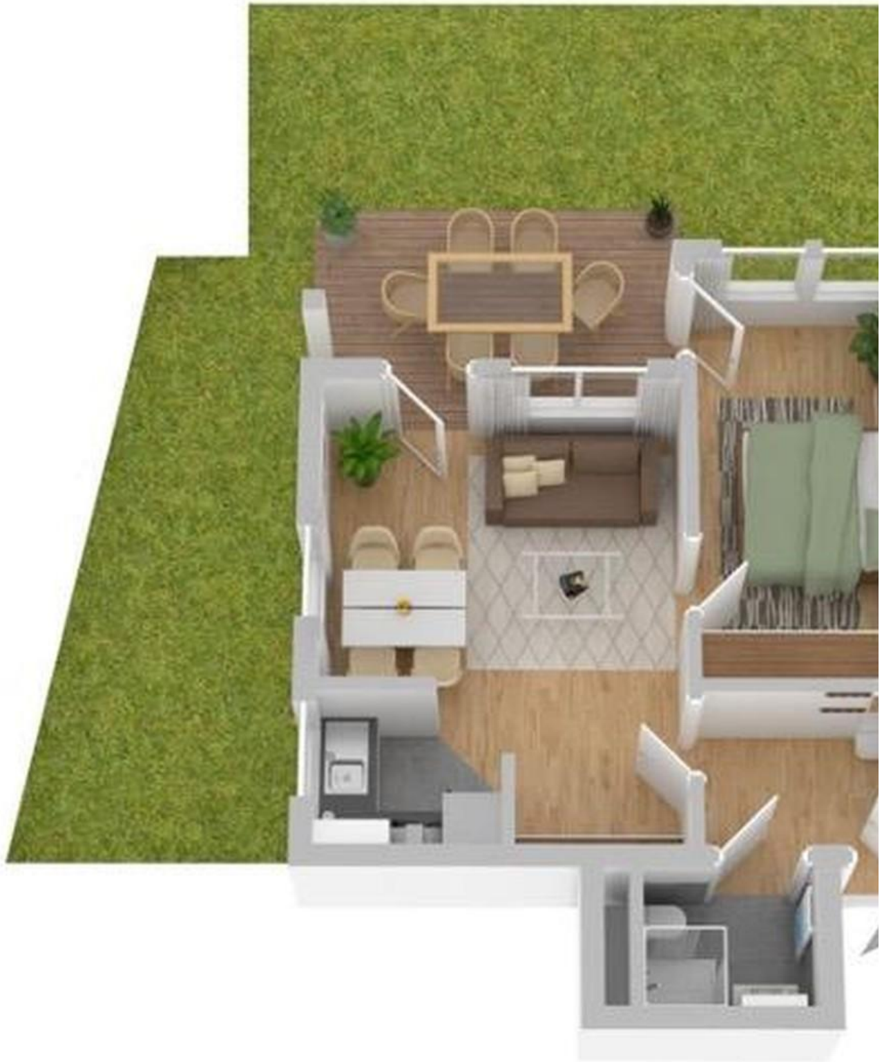
Grundriss EG (14)