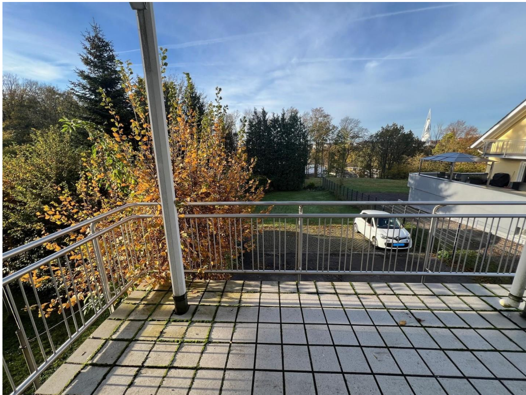
Balkon Blick ins Grüne