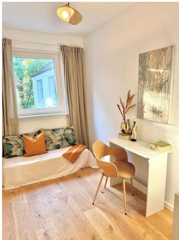
Arbeits- bzw. Kinderzimmer