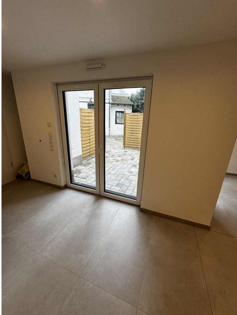
Blick zur Terrasse