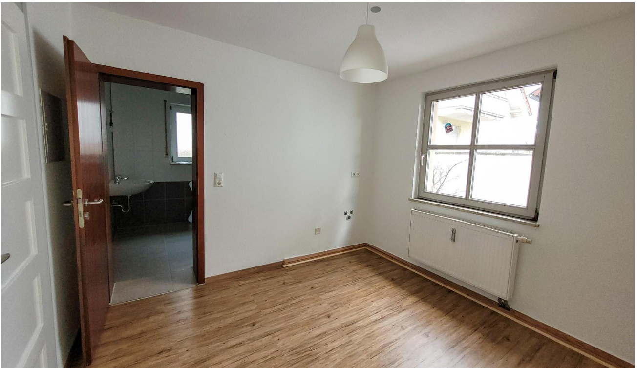
Schlafzimmer 1 mit Bad