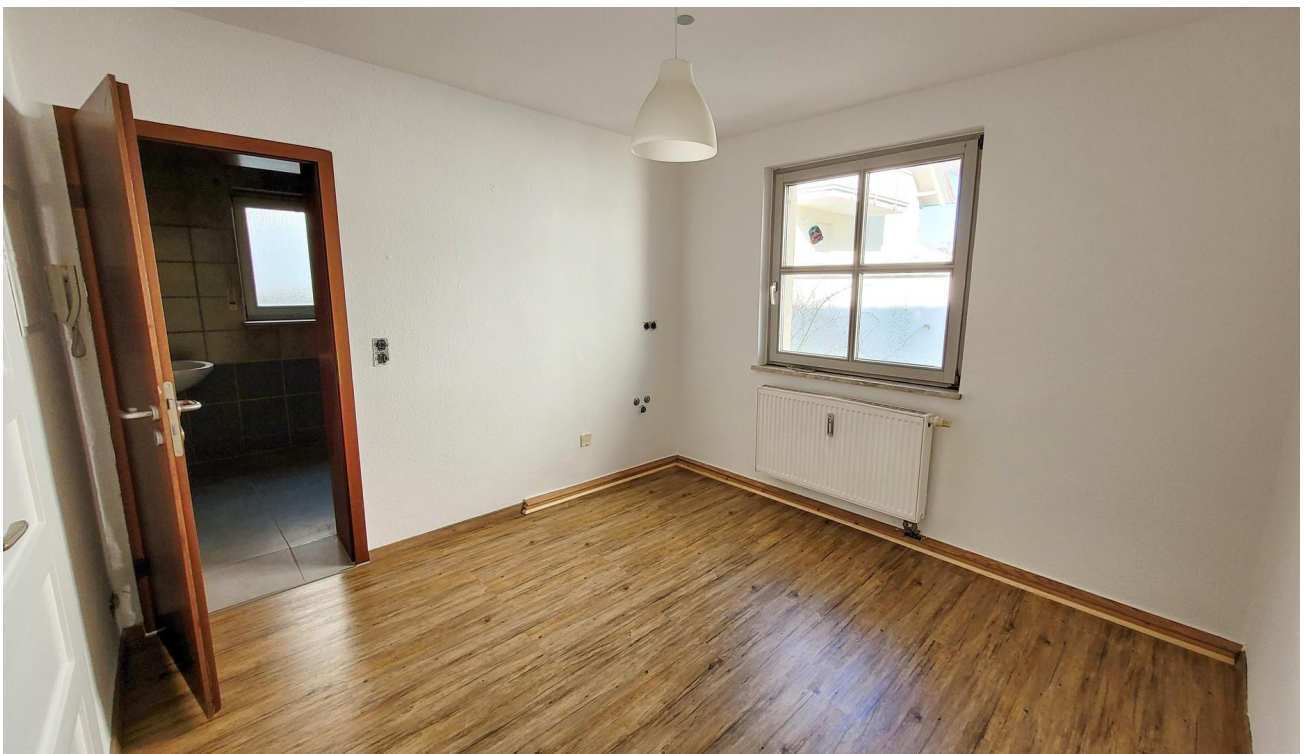
Schlafzimmer 1 mit Bad