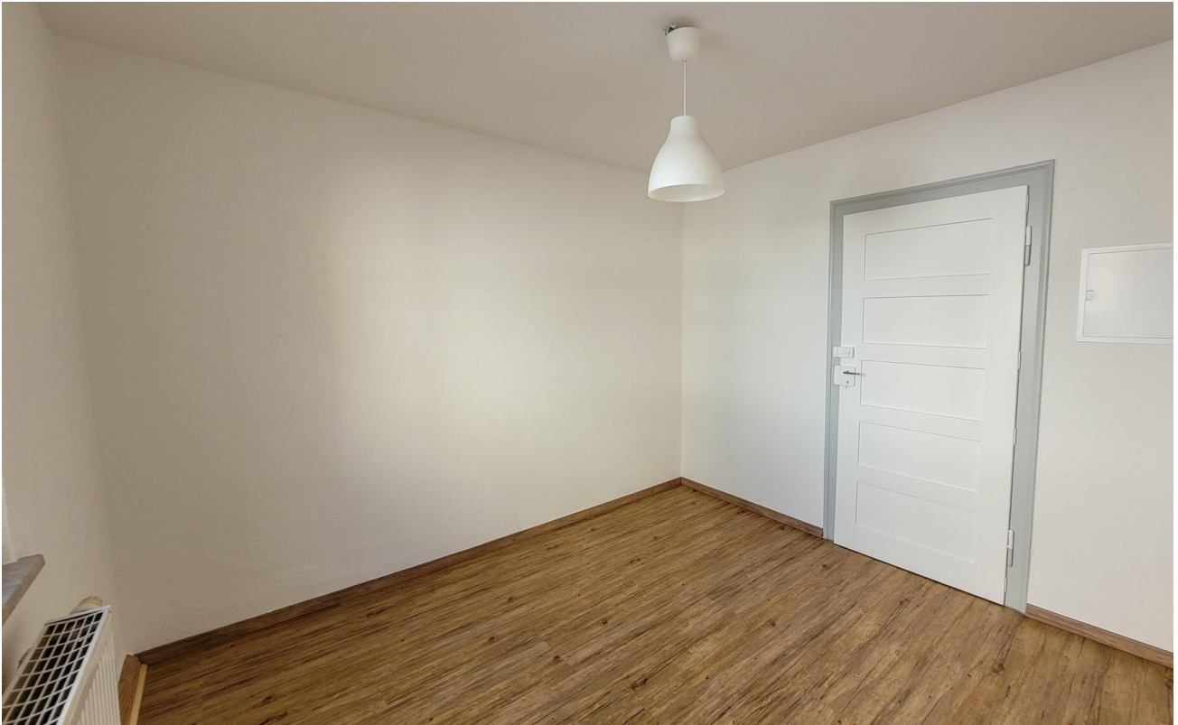
Schlafzimmer 1 mit Bad