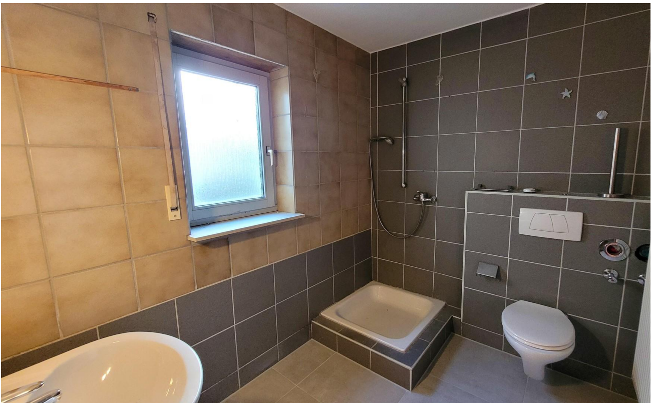
Bad 1 (wird renoviert)