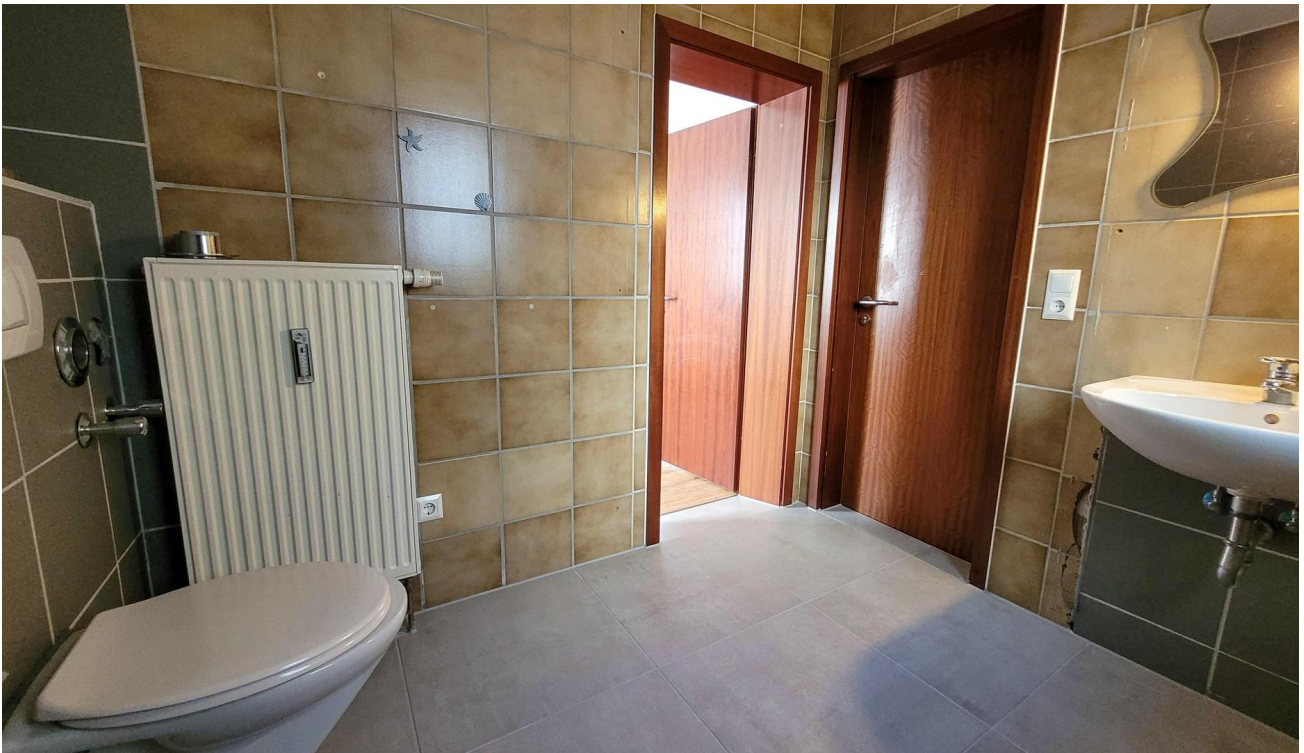
Bad 1 (wird renoviert)