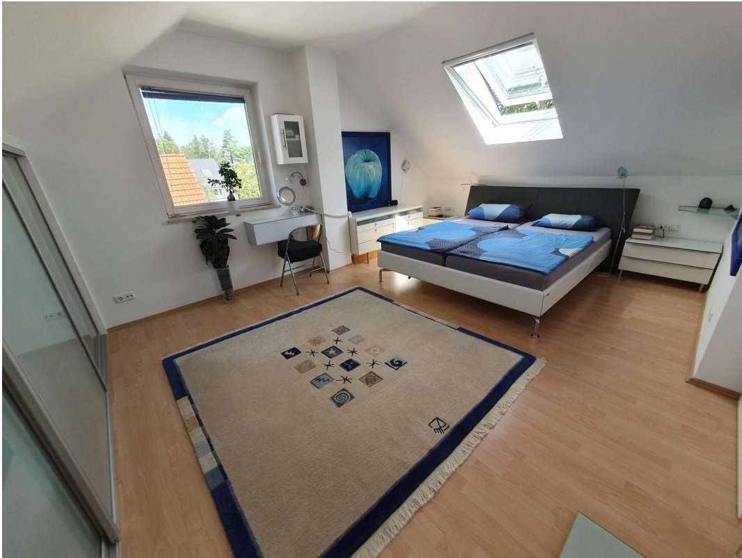
Schlafzimmer im DG