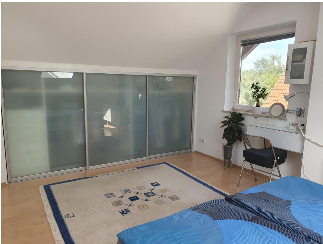
Einbauschränk im Schlafzimmer