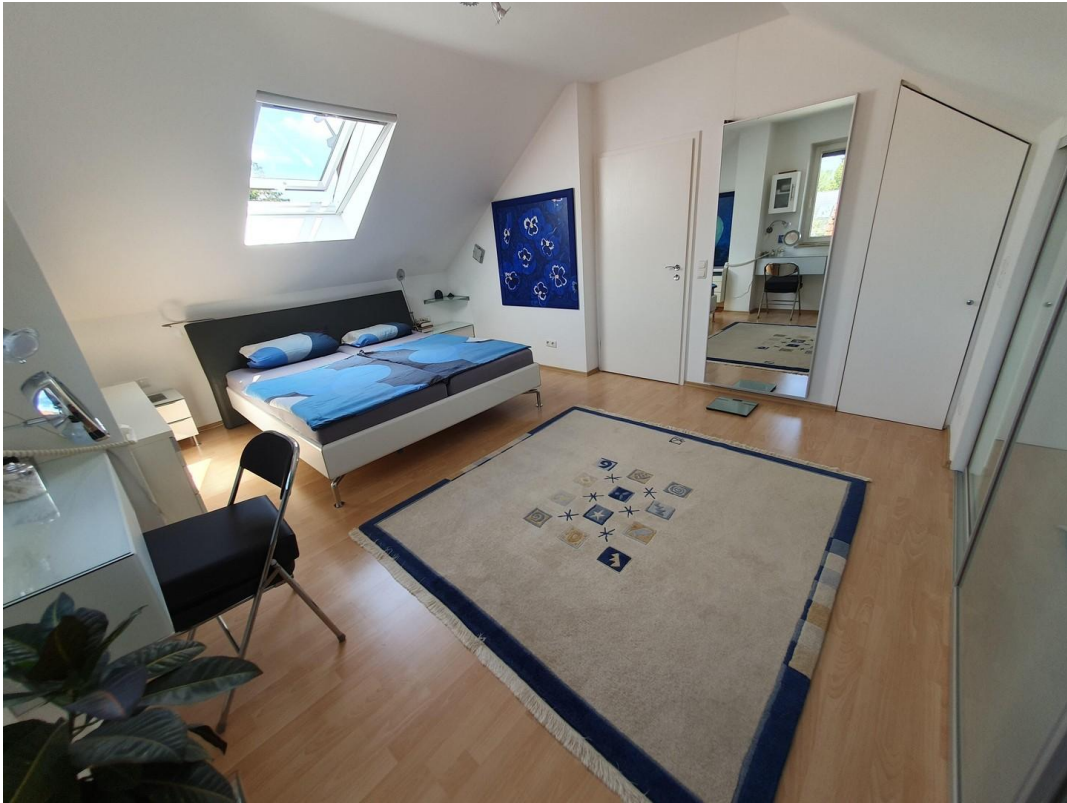
SZ mit begehbar. Schrank