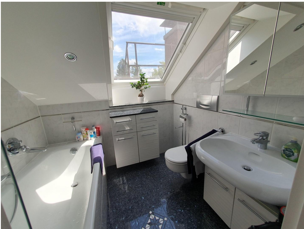
Bad im DG