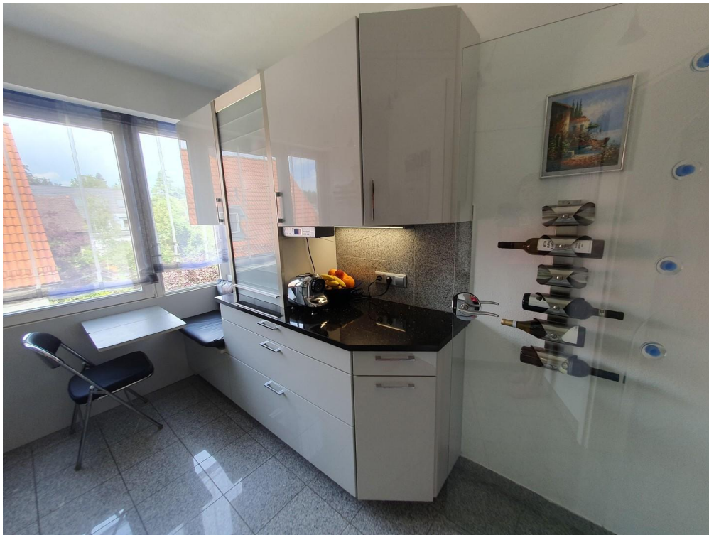
Frühstückstisch in der Küche