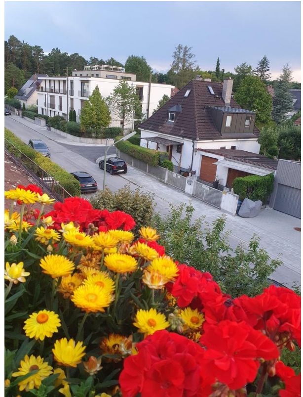
Blick von der Dachterrasse