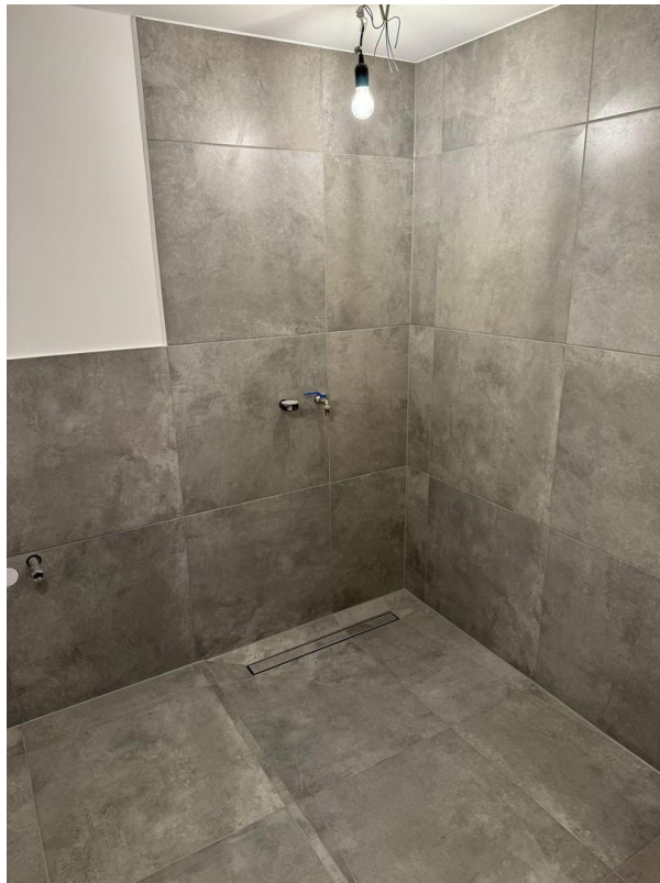
Neues Bad in Erstellung