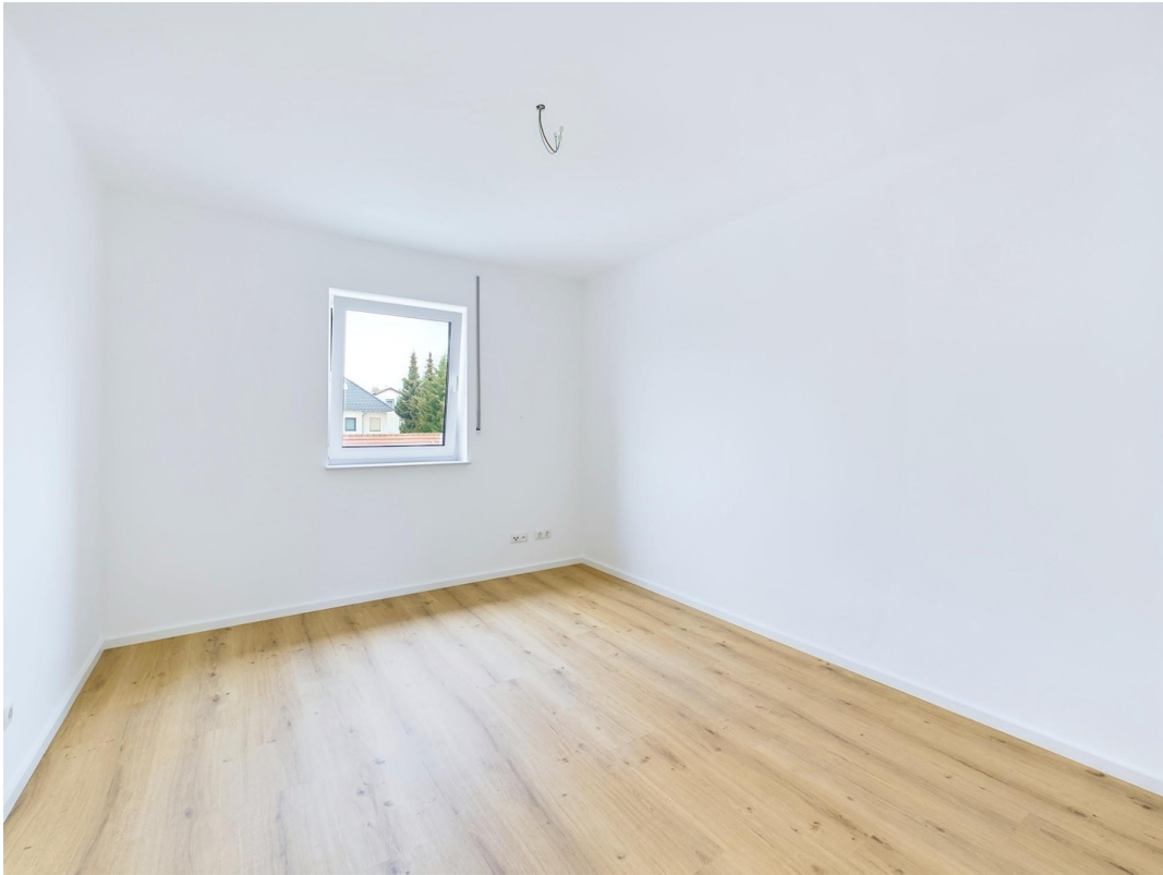
Kinderzimmer 2/Home Office