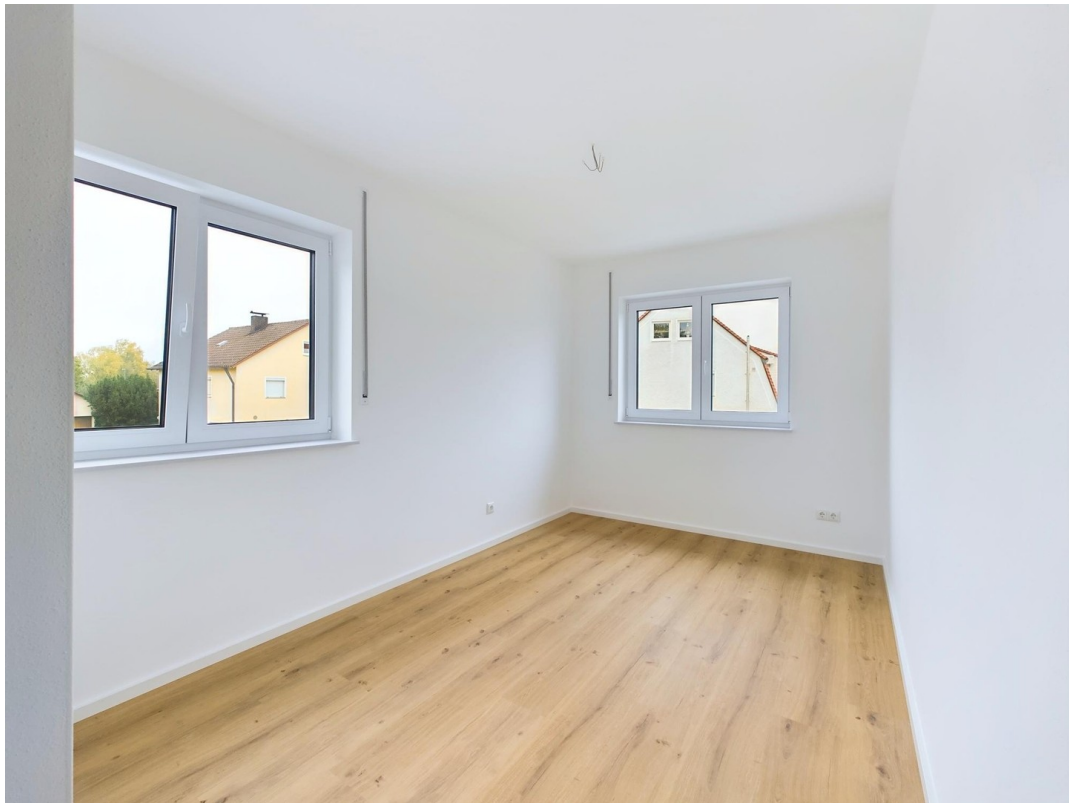
Kinderzimmer 1/Home Office