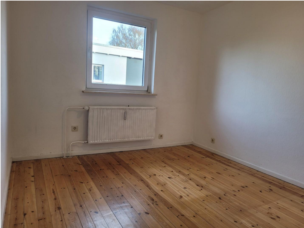
2. Schlafzimmer oben