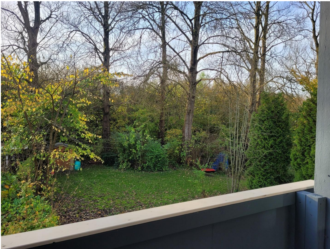
Aussicht vom Balkon hinten