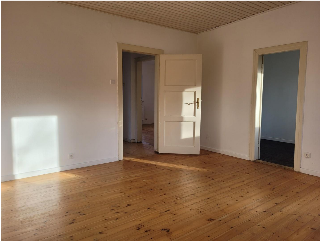
1. Schlafzimmer oben