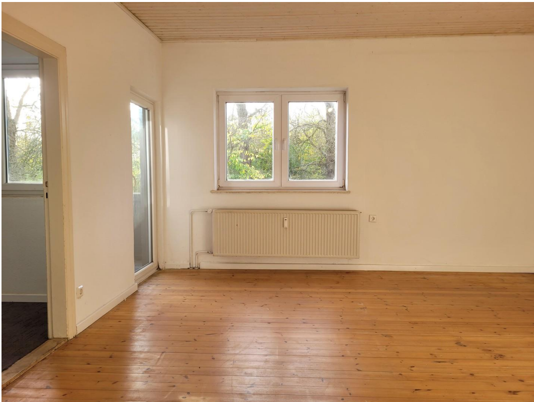
1. Schlafzimmer oben