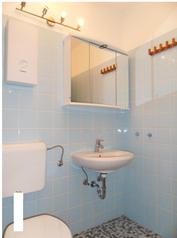
Badezimmer mit altem Boden