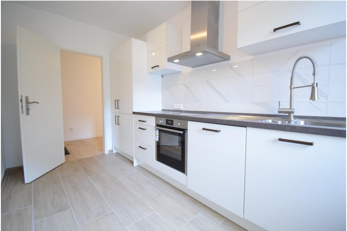
Küche (Nobilis )