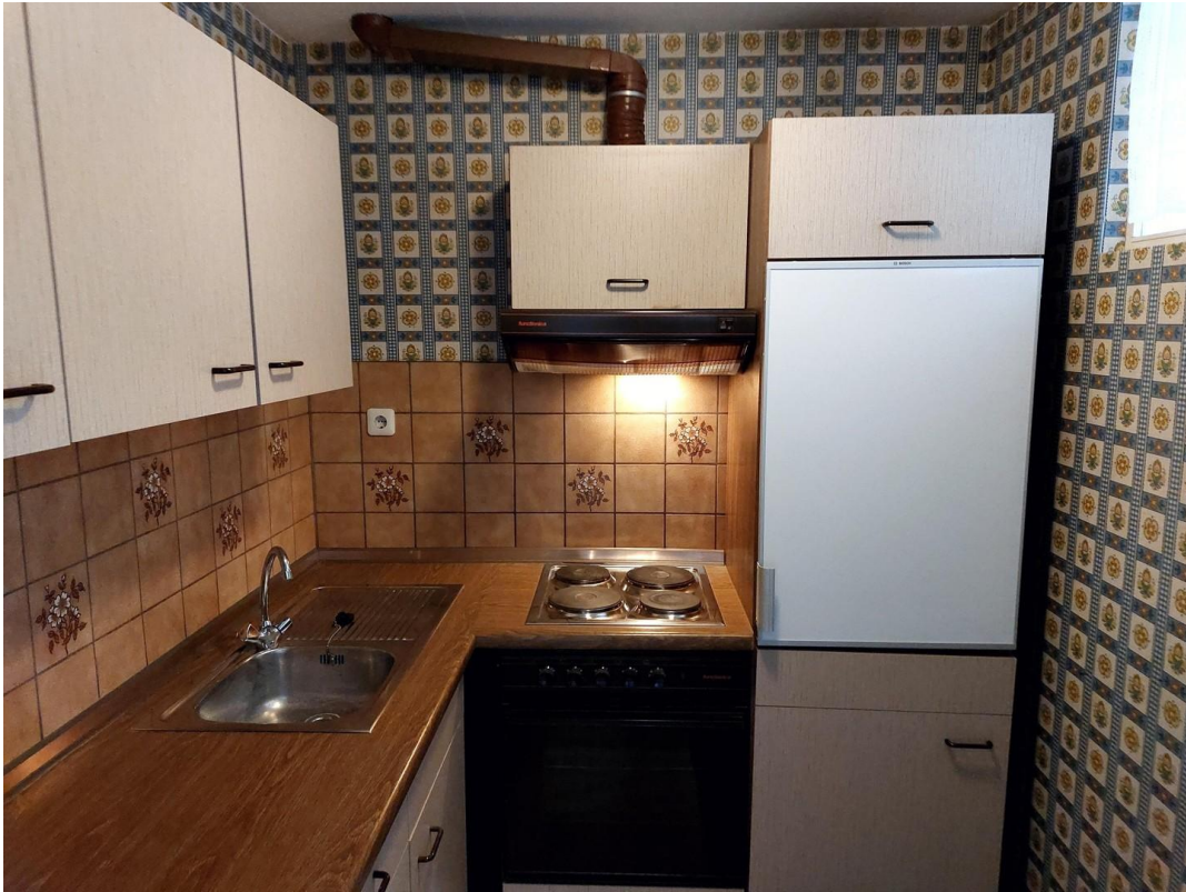
Küche mit EBK