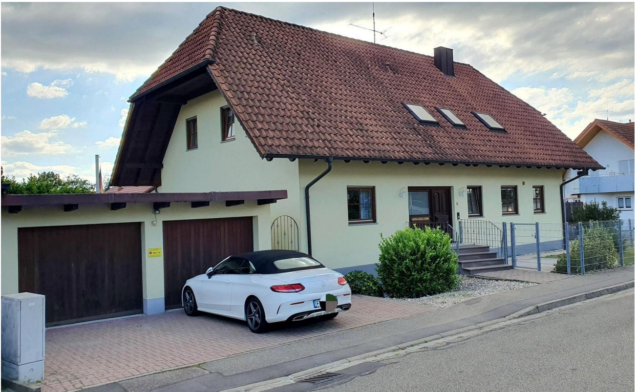
Haus Front mit Doppegarage