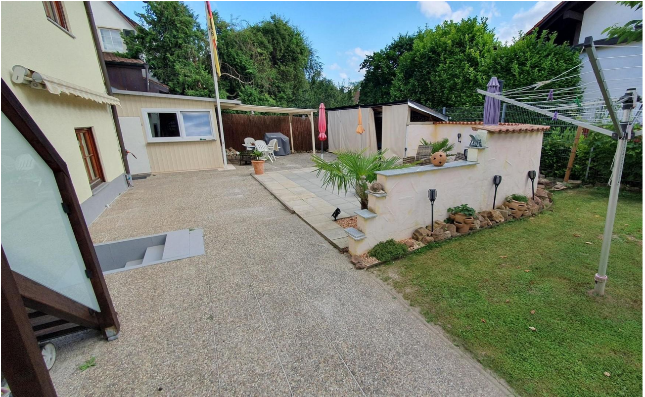
Garten mit Terrasse