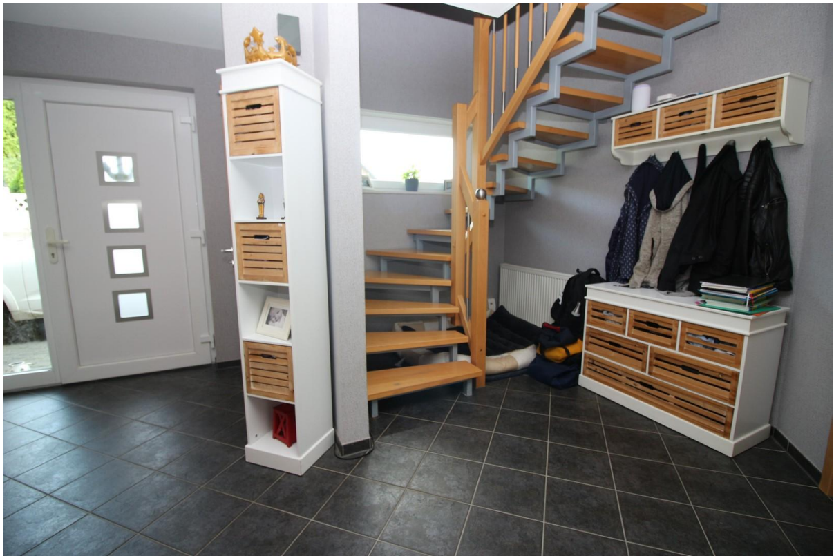
Treppe ins OG