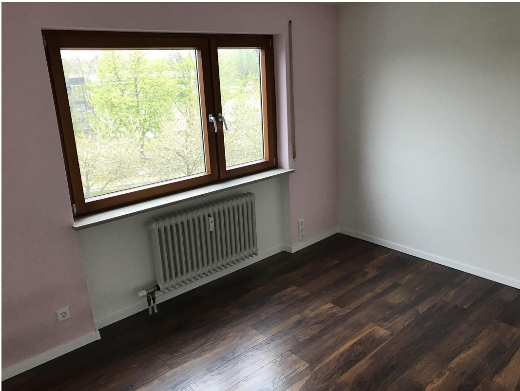
Schlafzimmer № 2