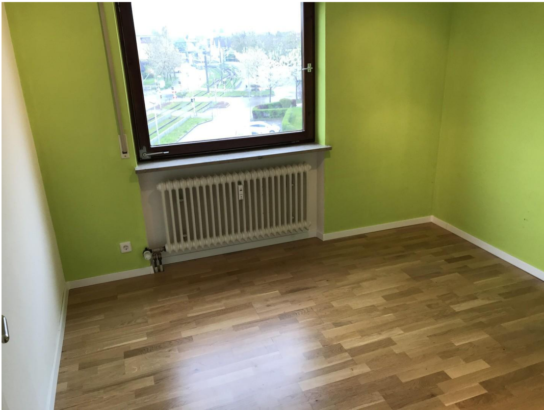
Schlafzimmer № 3