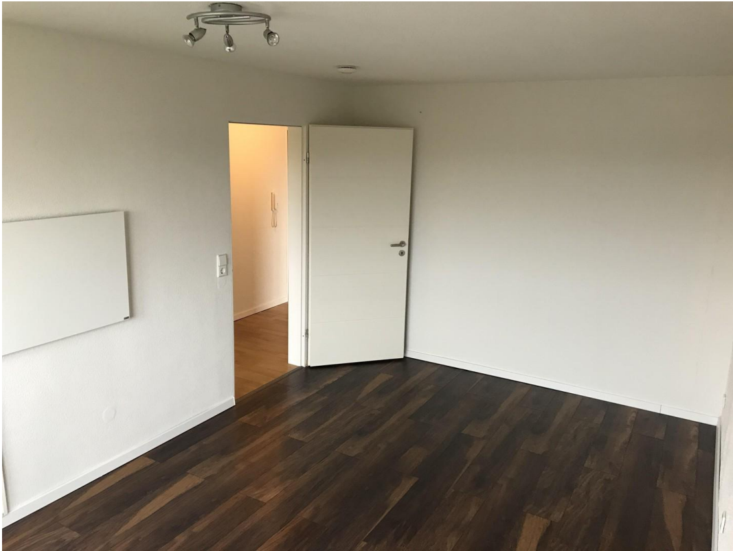
Schlafzimmer № 1