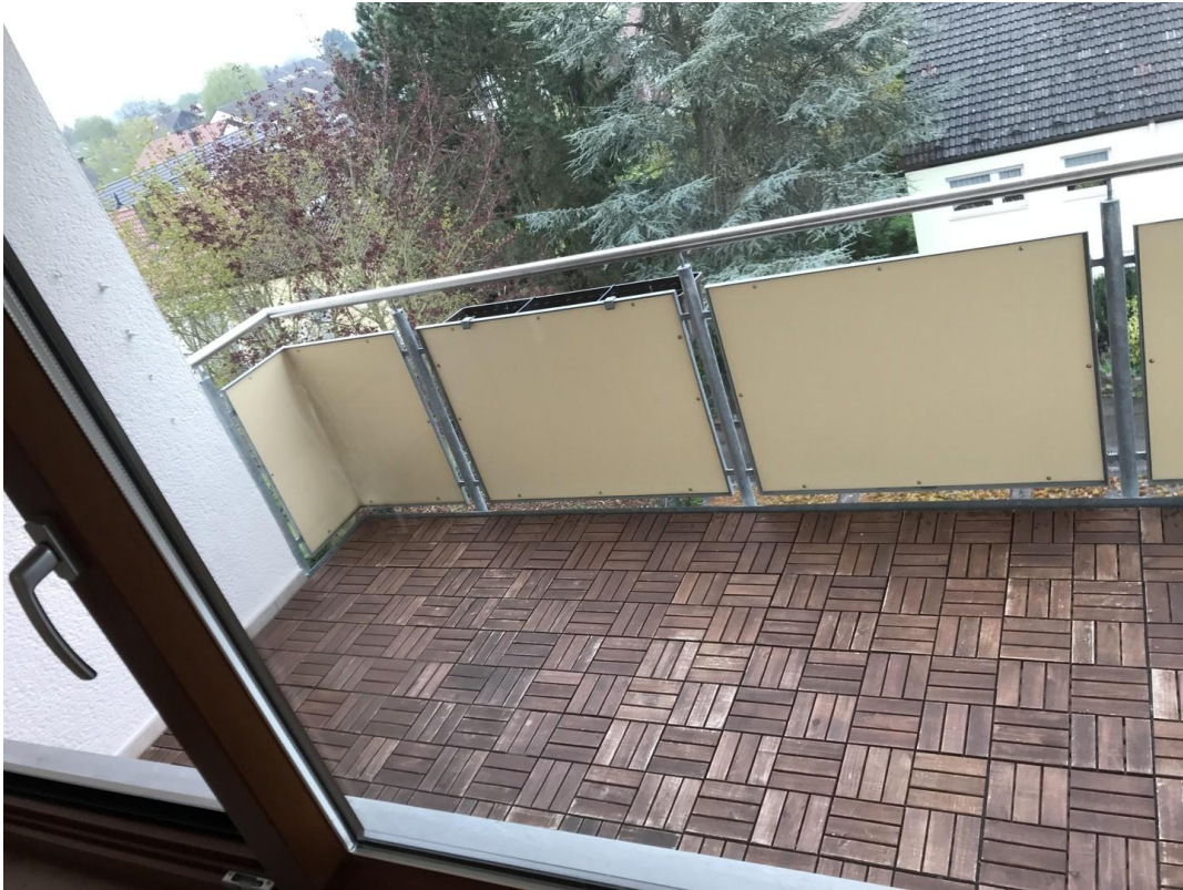
Balkon mit Blick ins Grüne