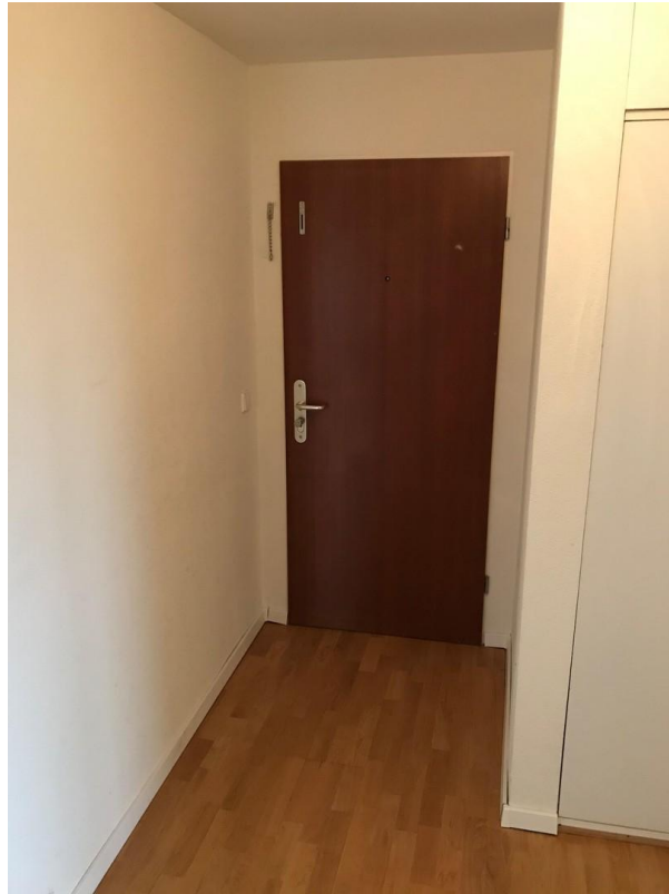
Wohnungseingang von innen