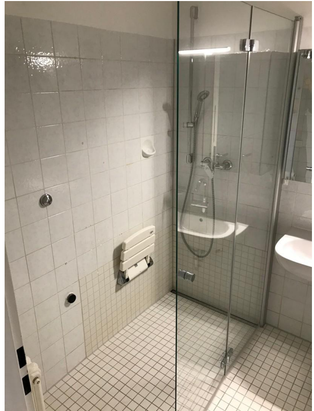
Bad mit Dusche und Badewanne