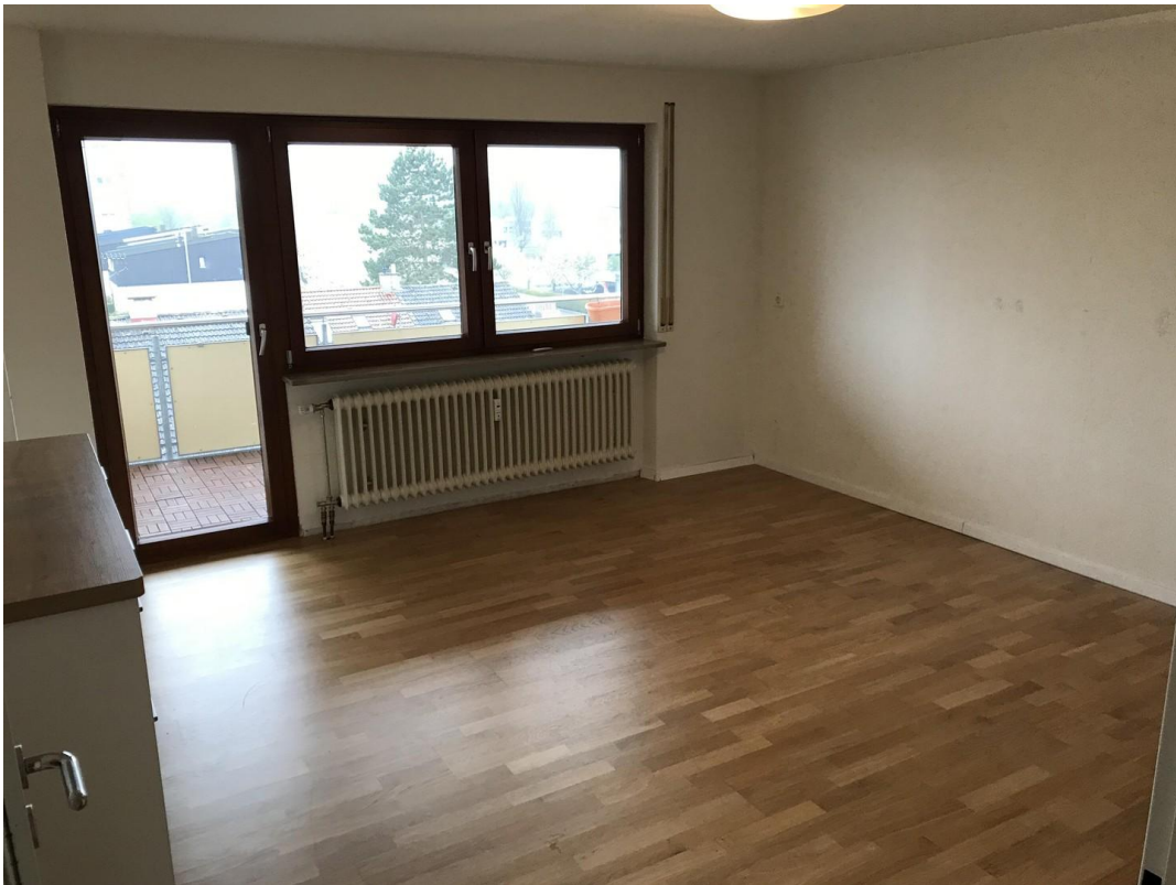
Wohnzimmer mit Balkon