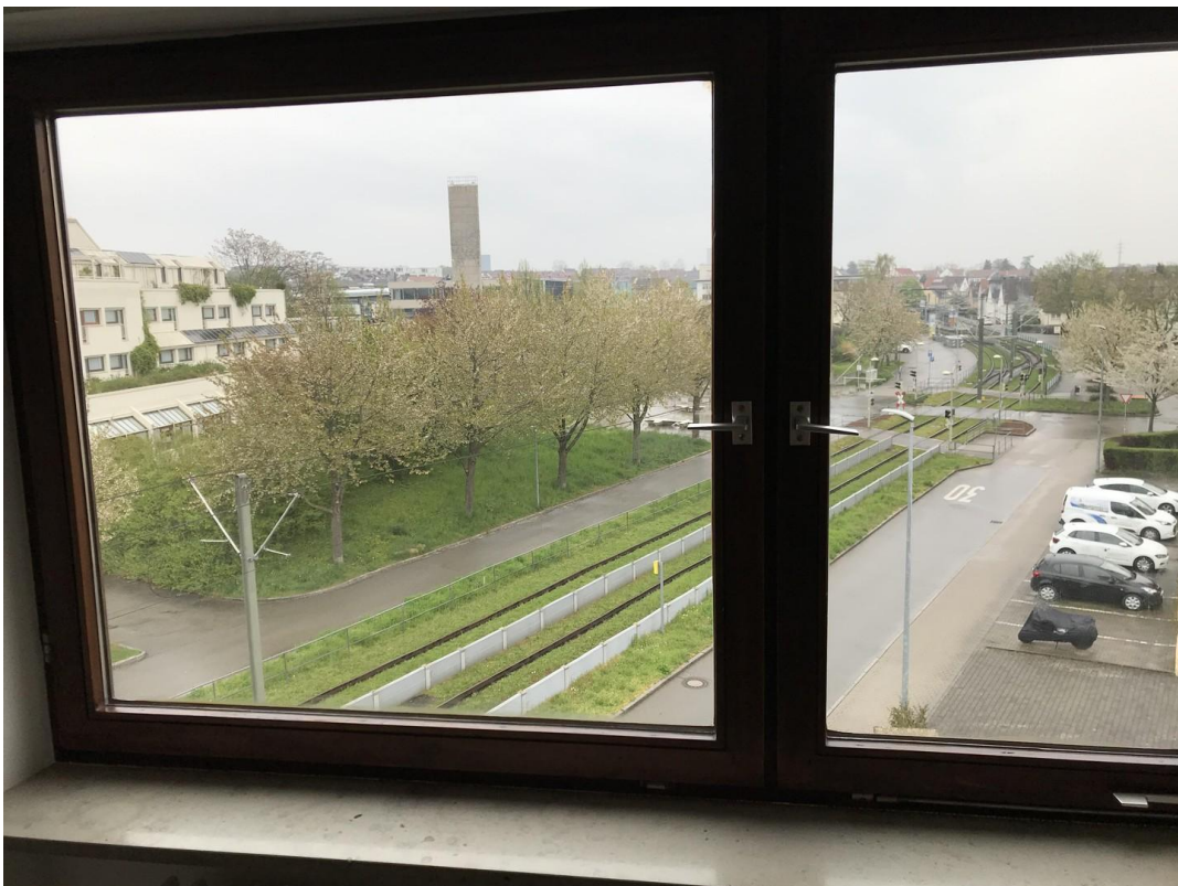
Schlafzimmer Blick nach außen