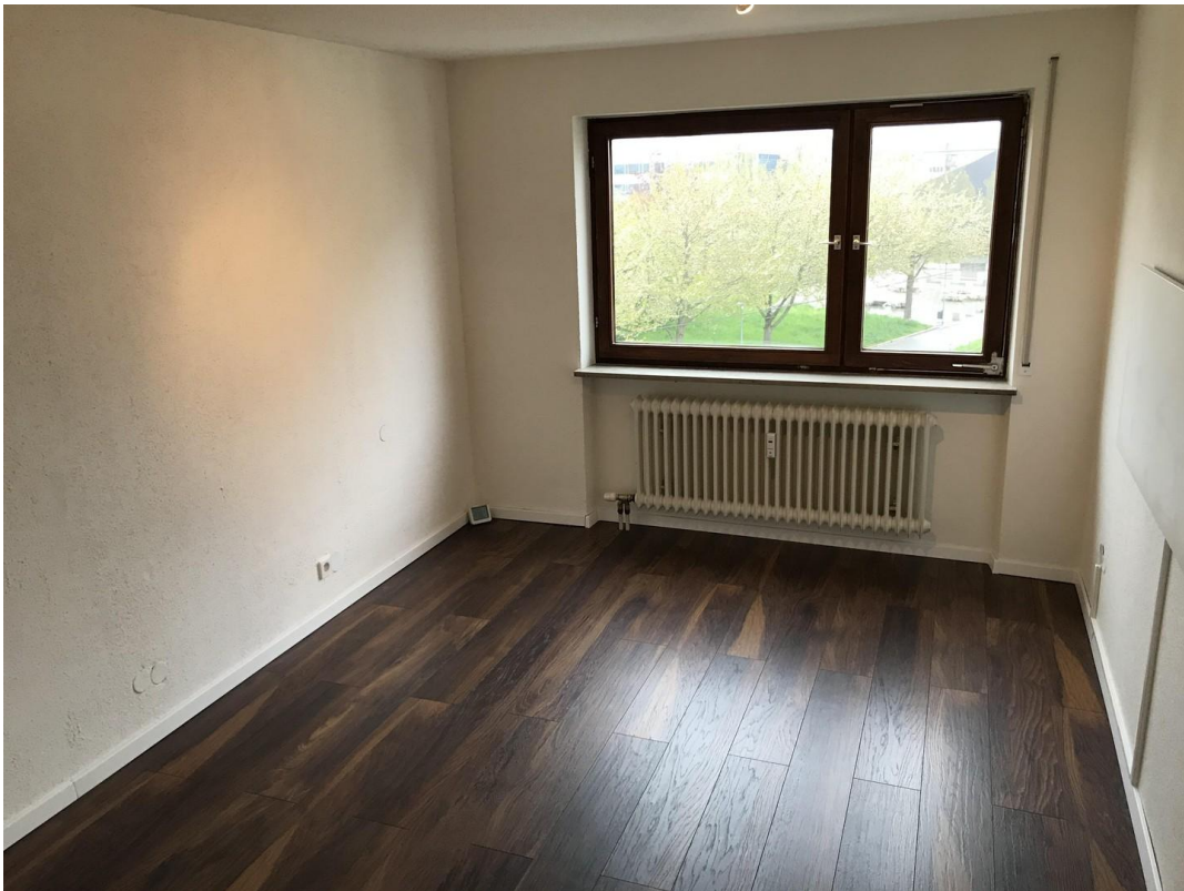
Schlafzimmer № 1