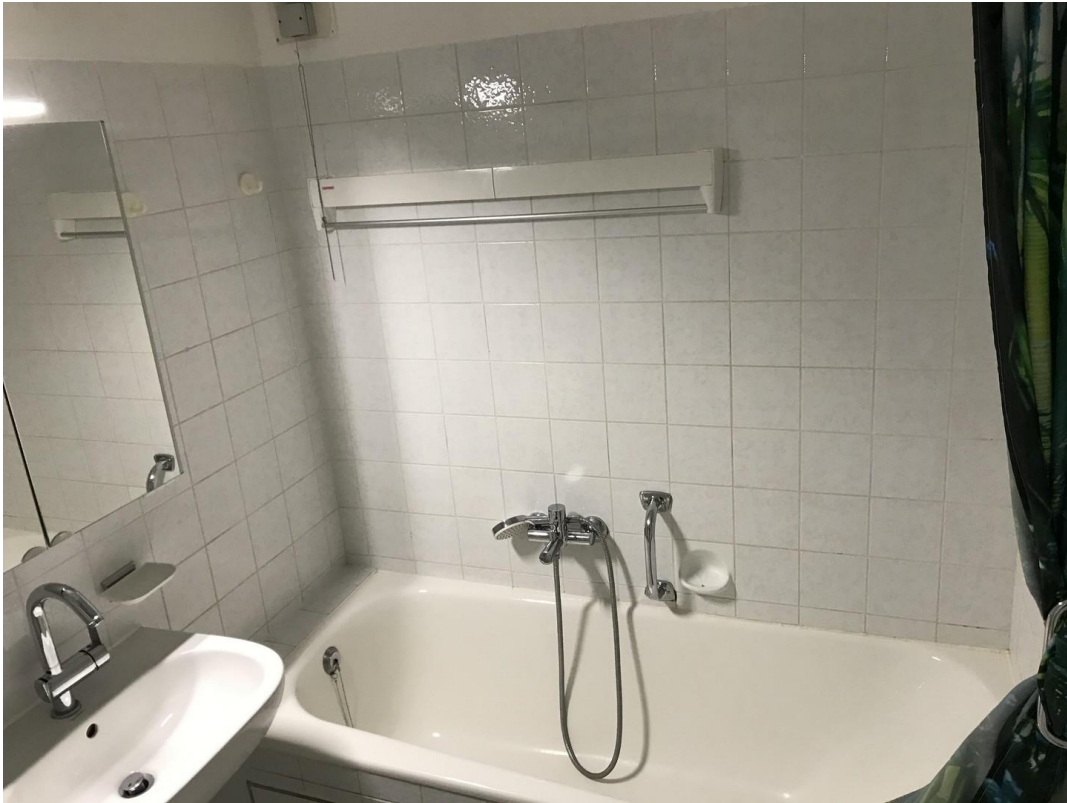
Bad mit Dusche und Badewanne