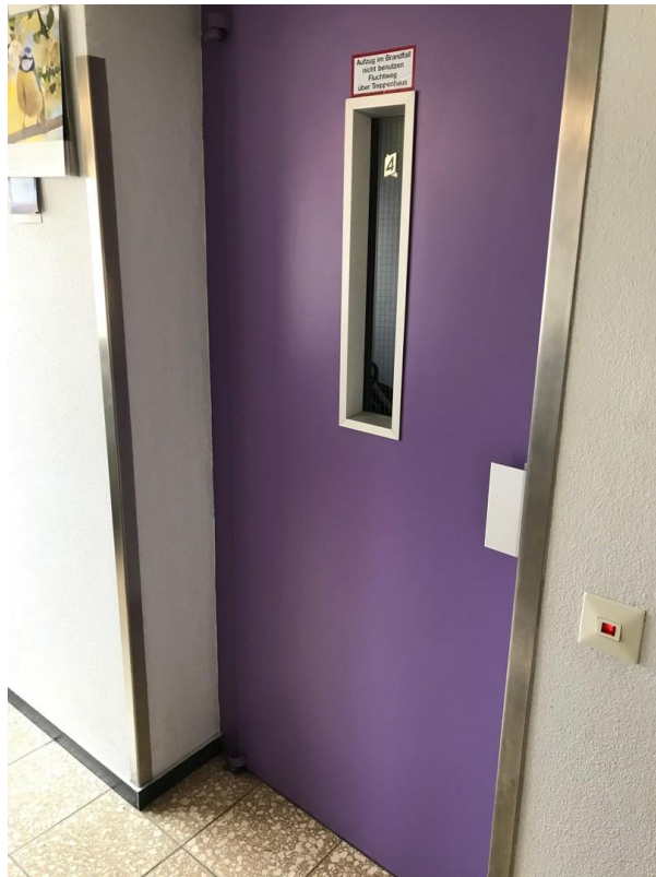
Aufzug im Treppenhaus