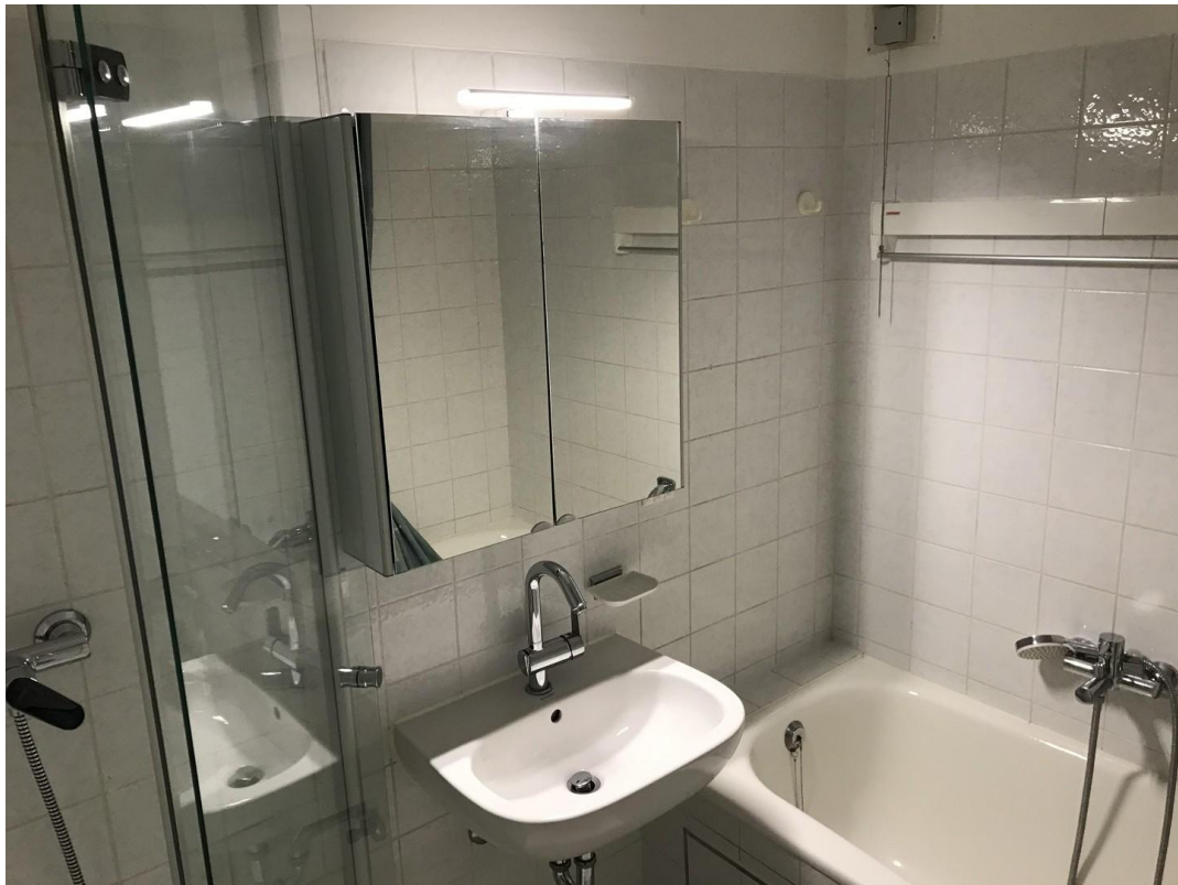
Bad mit Dusche und Badewanne