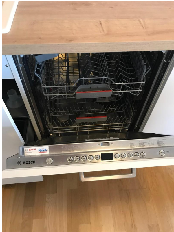
Große moderne Spülmaschine