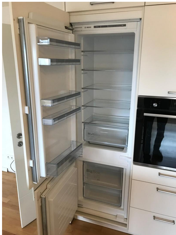
Wohnküche m. Kühl/Gefrierkombi