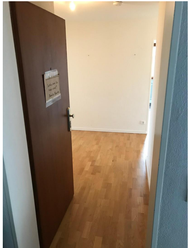
Wohnungseingang von außen