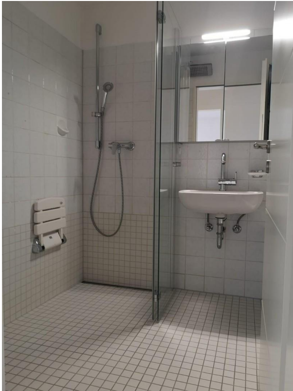
Bad mit Dusche und Badewanne