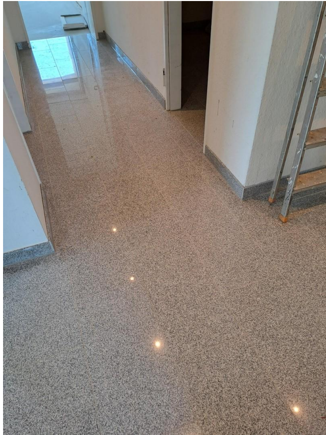
Wohnung Diele - Granitboden