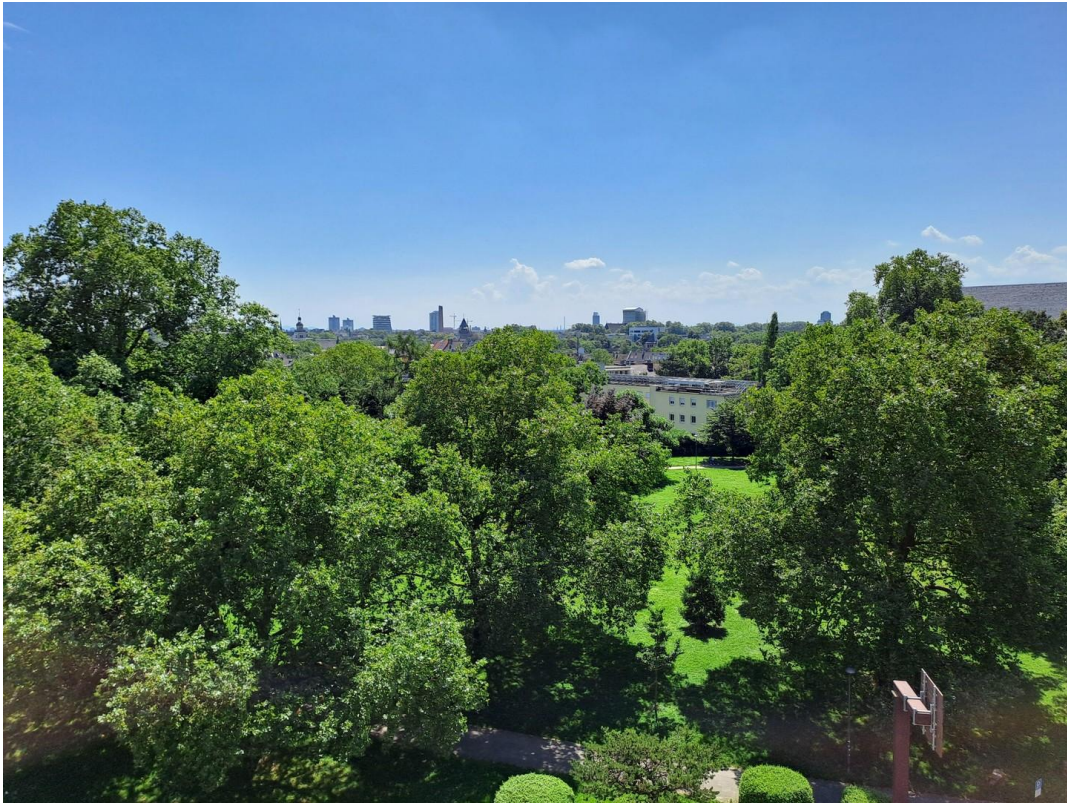
Aussicht - Süden