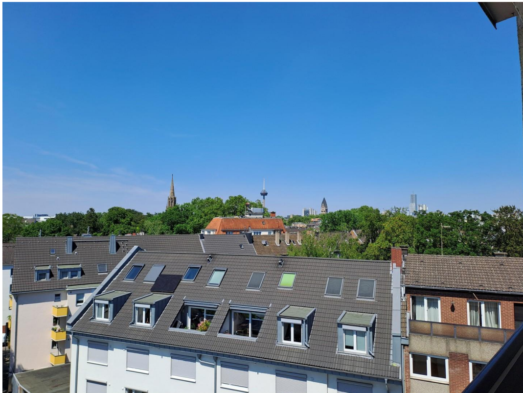
Aussicht v. Balkon