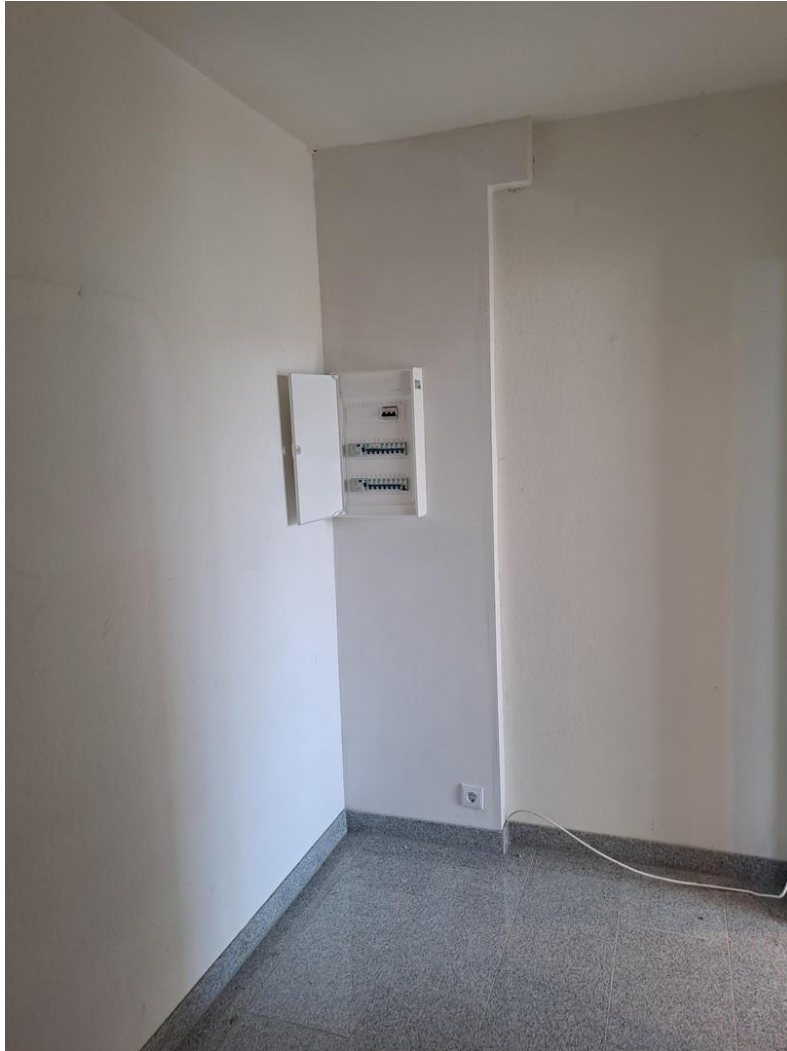
Garderobe oder Abstellraum