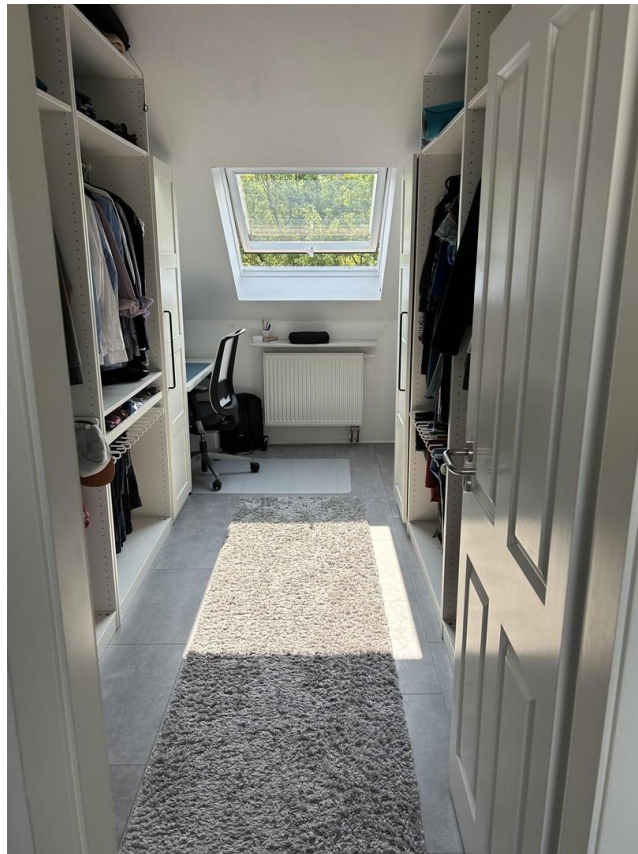
Ankleidezimmer / Homeoffice