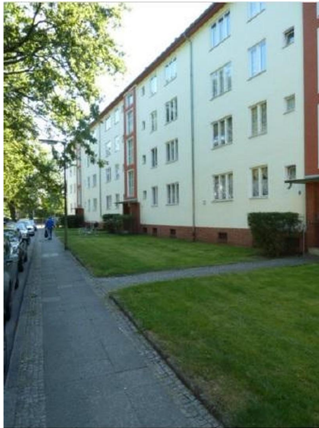
Ost Seite des Hauses