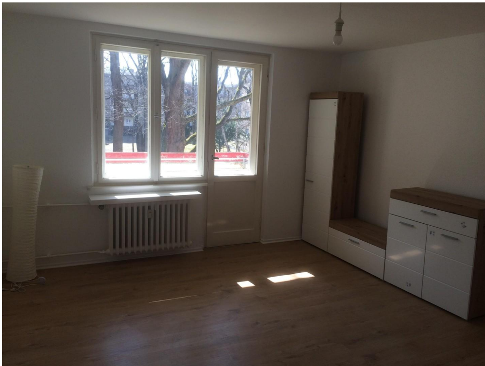
Zimmer1 mit Balkon