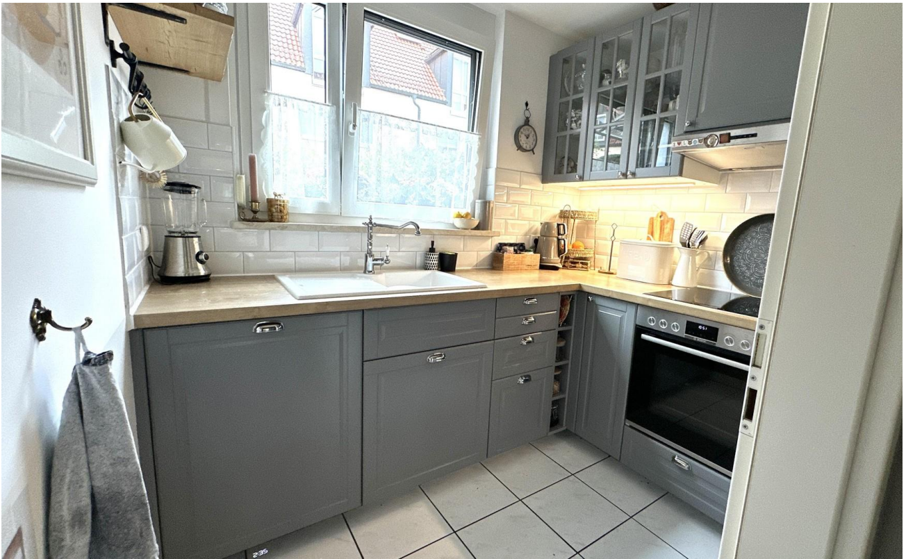
Küche neu seit 2020