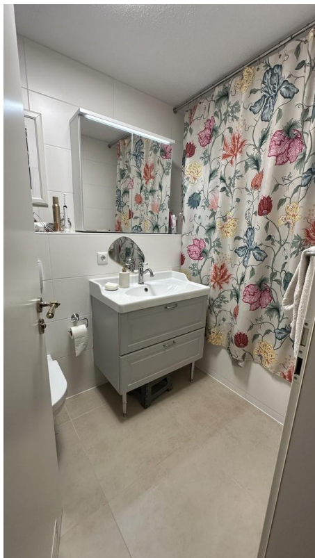
Bad im 1.Stock Neu seit 2021