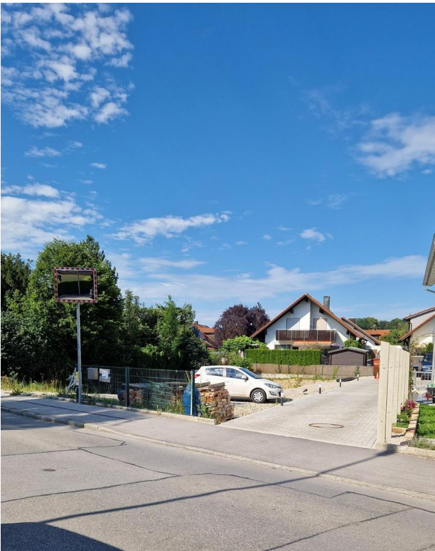
Blick von der Straße