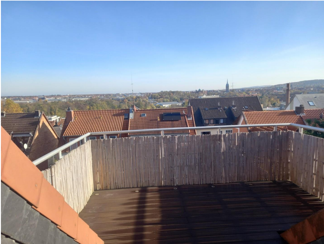
sehr schöner Blick ü.Hildesh.