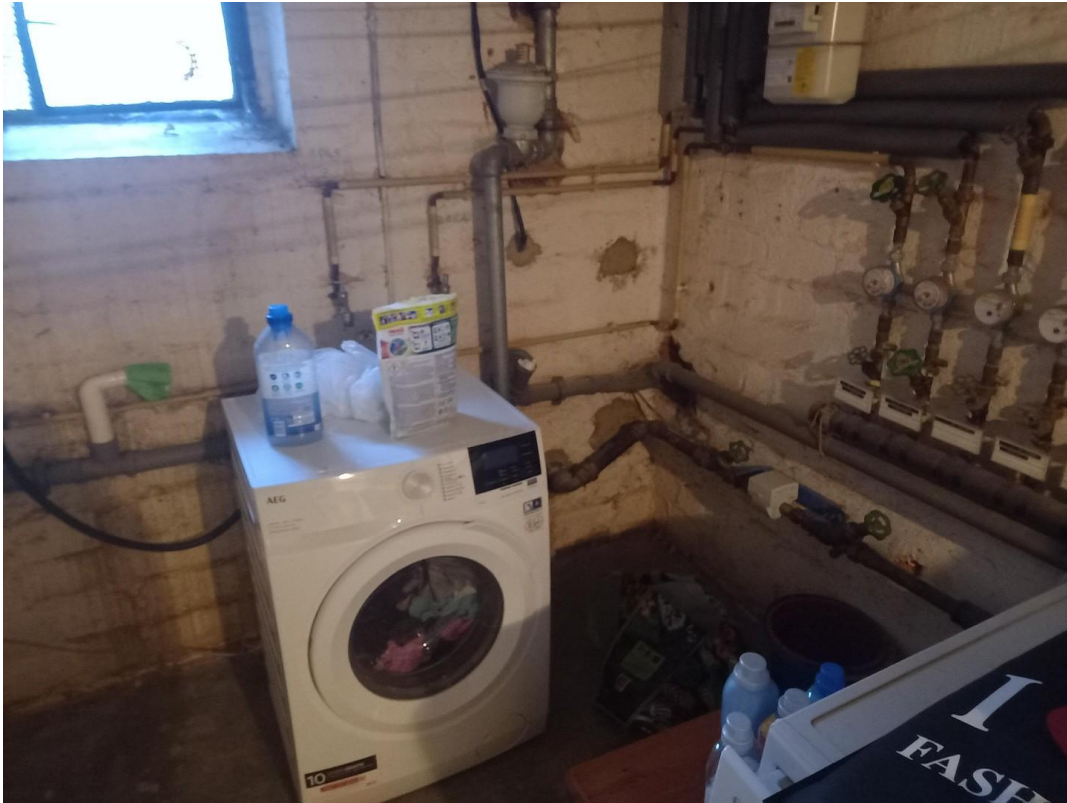
Kellerraum für Waschmaschine