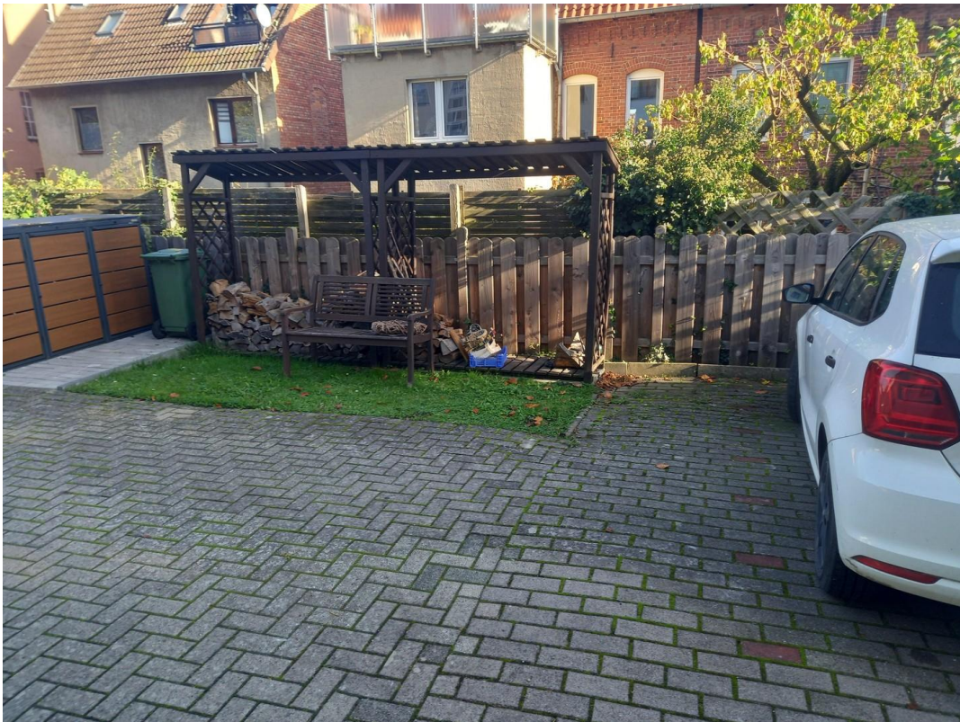
PKW Stellplatz hinterm Haus