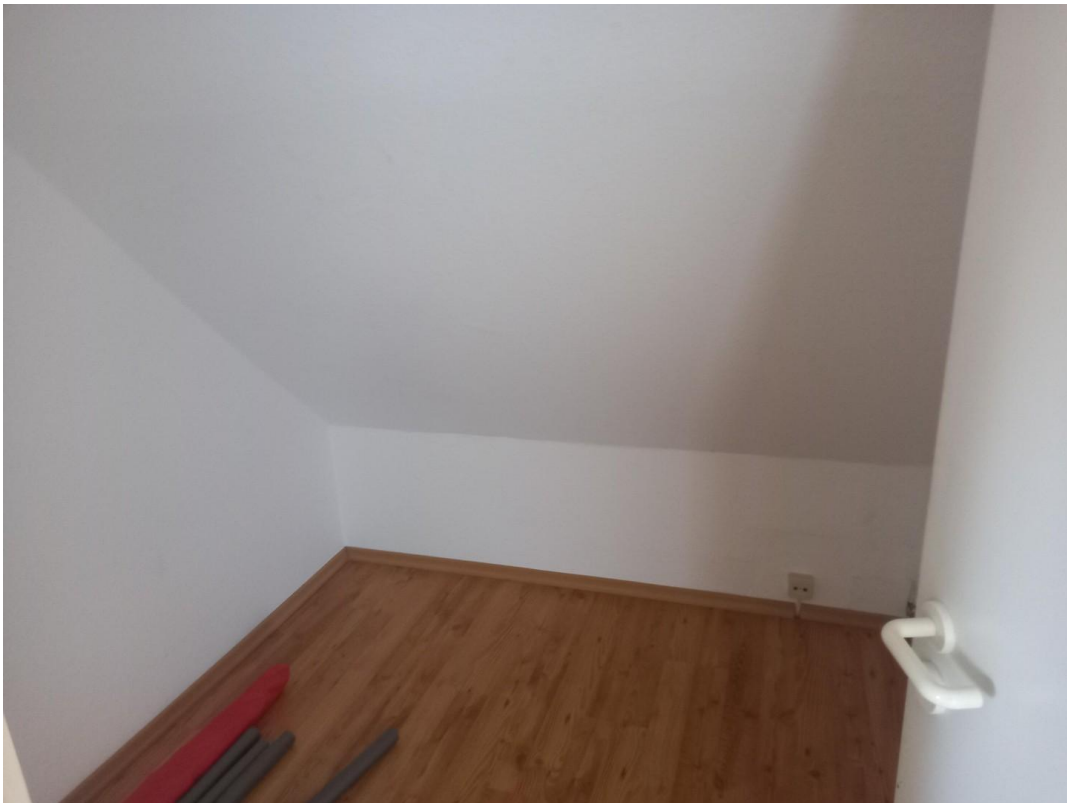
DG Schlafzimmer Eltern