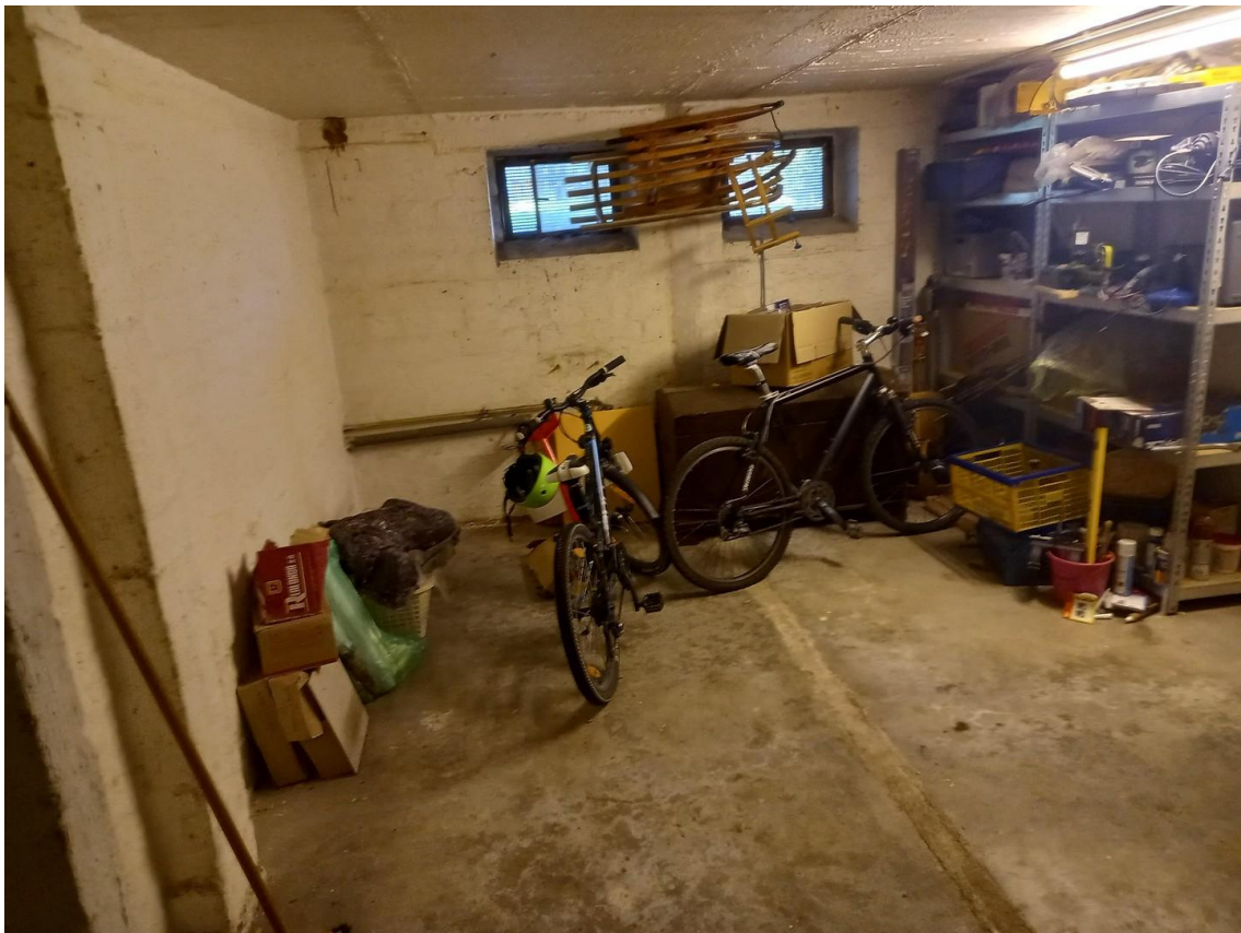
Kellerraum wird noch leer