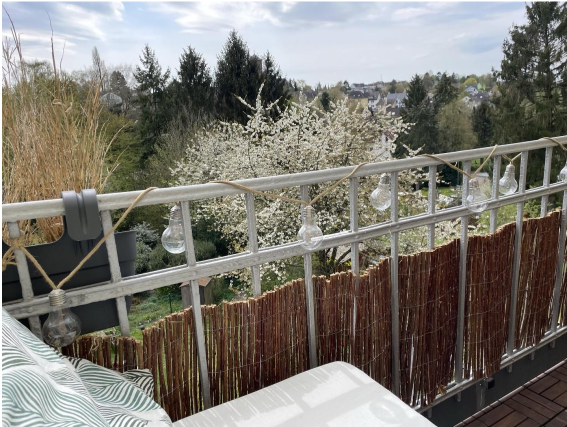
Beispiel Blick vom Balkon