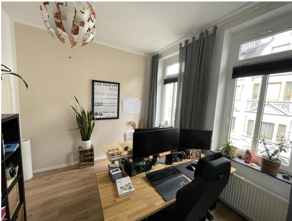
Beispiel Kinderzimmer / Arbeit