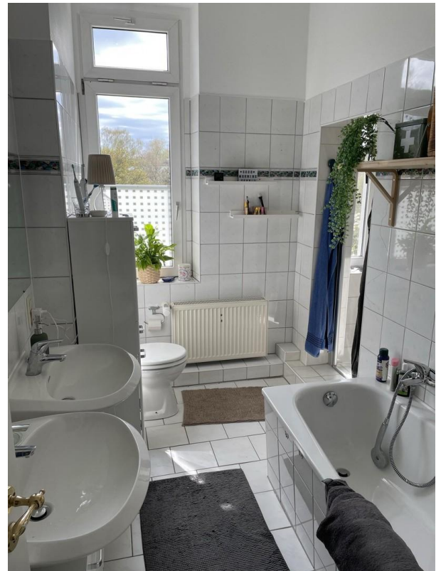
Beispiel Bad Wanne und Dusche