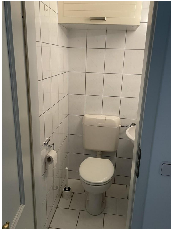
Beispiel Gäste WC