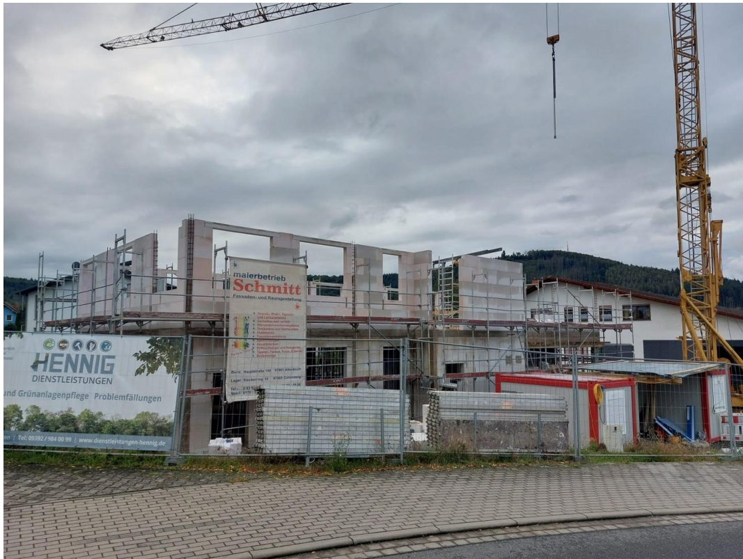
Aktuelle Außenansicht Bauphase