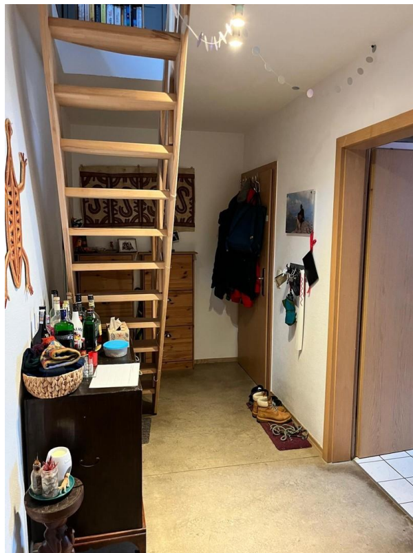
Diele und Treppe in Dachboden