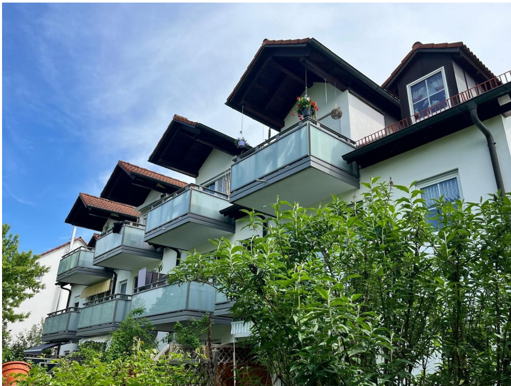
Blick vom Garten