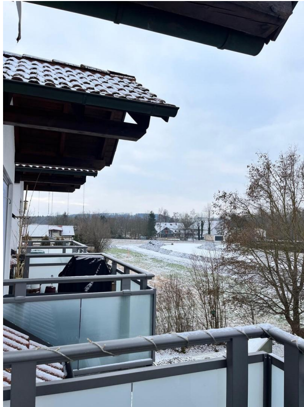
Einer von 2 Balkonen