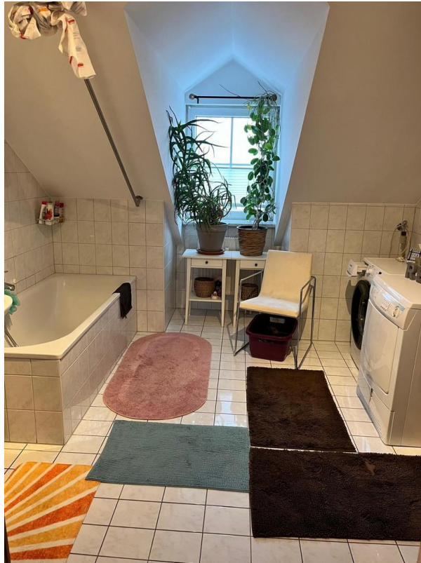
Bad mit Badewanne und Waschmas