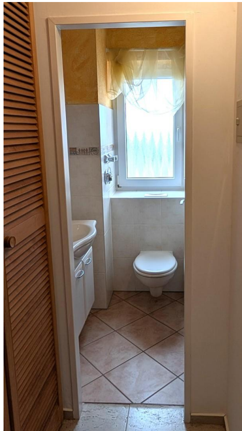
Flur/Blick auf Gäste WC