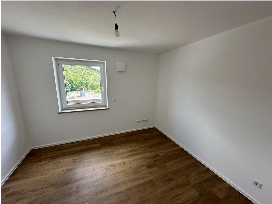
Kinderzimmer bzw. Büro