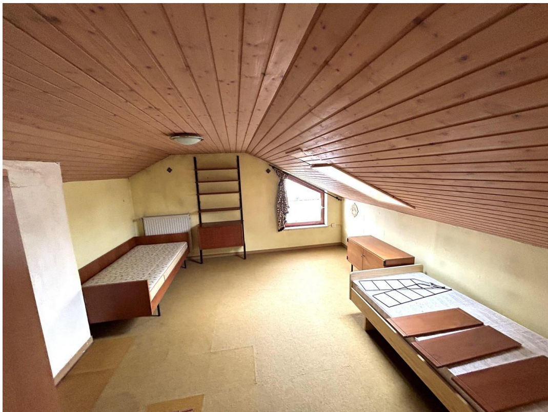
DG Raum 2