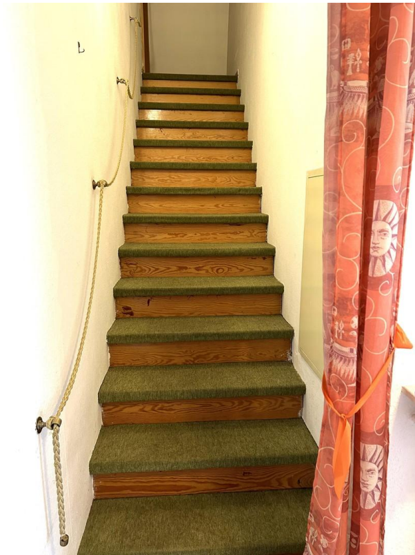
Treppe zum Dachgeschoss