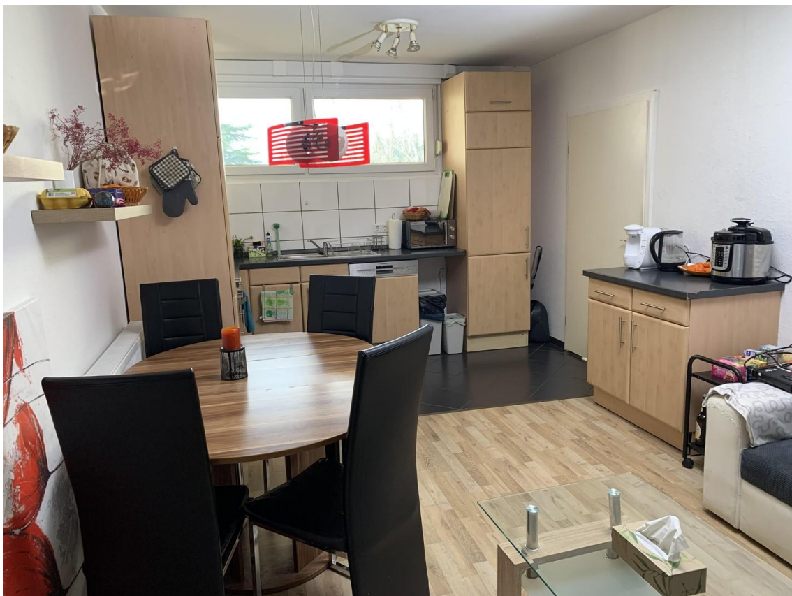
Küche im Wohn-Esszimmer