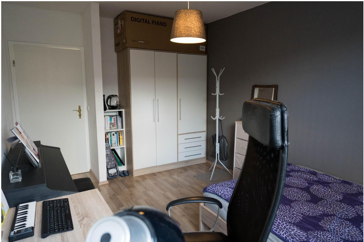
Zimmer 3 (2)