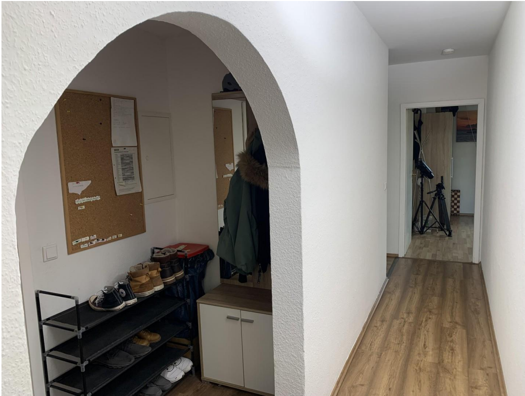
Garderobe und Flur