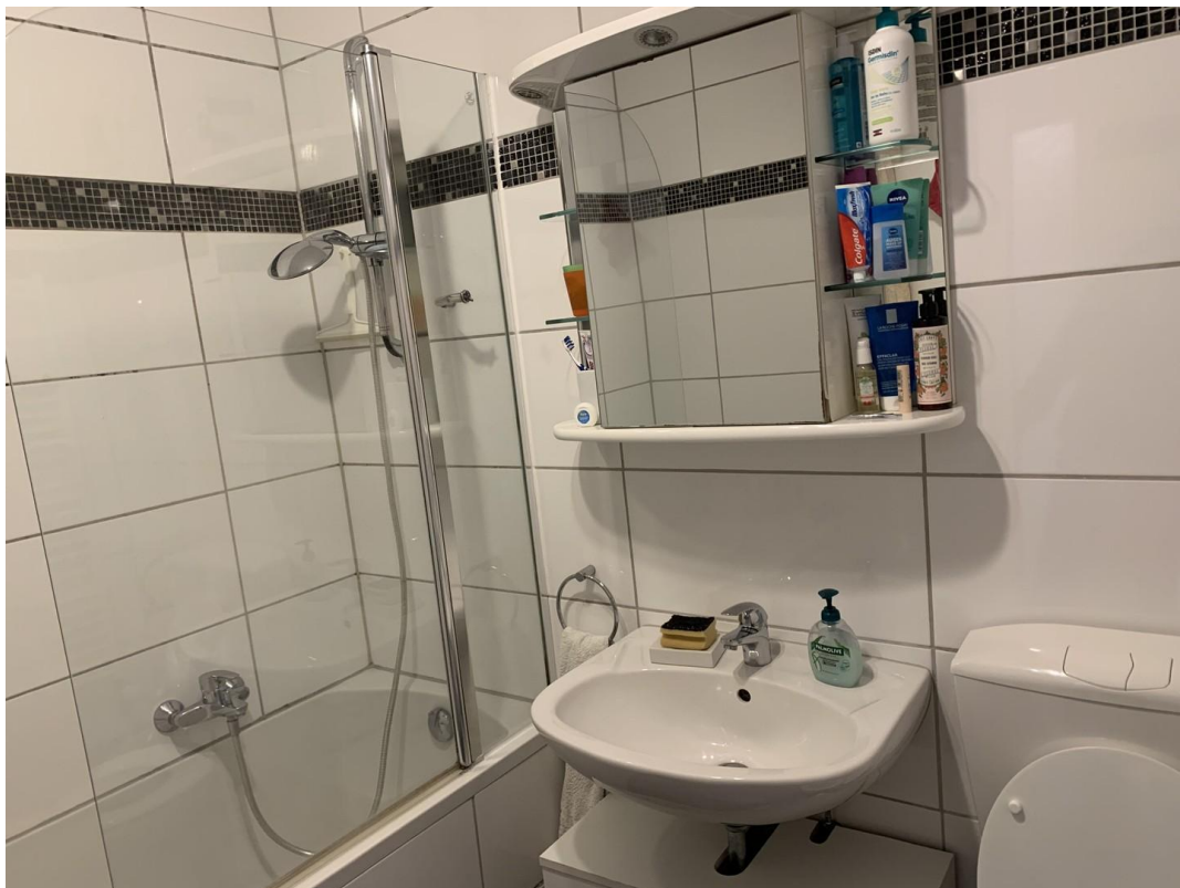
großes Bad (2)