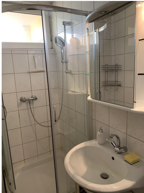
kleines Bad (2)