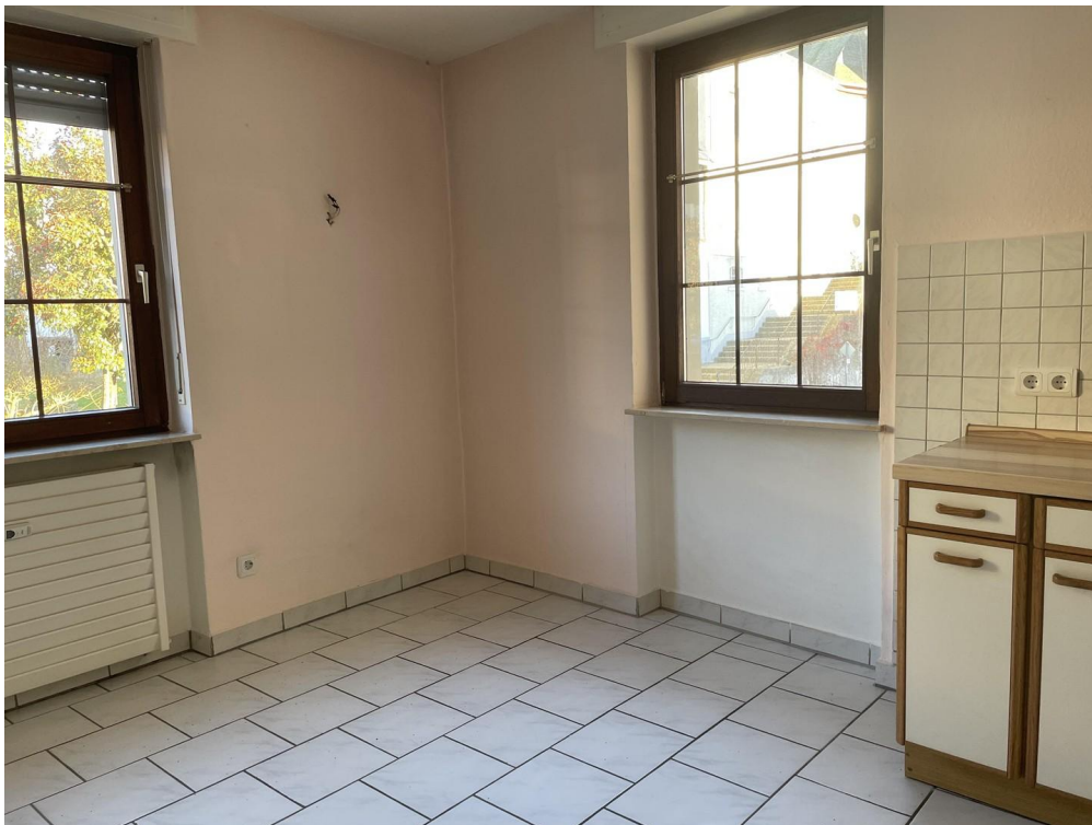
Küche mit Essbereich