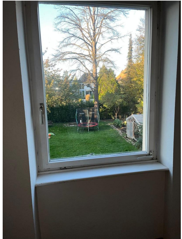
Blick auf Garten