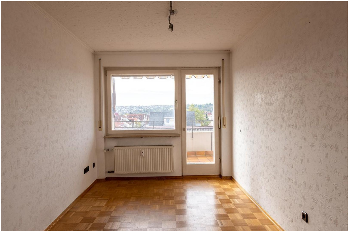
Arbeits- oder Kinderzimmer