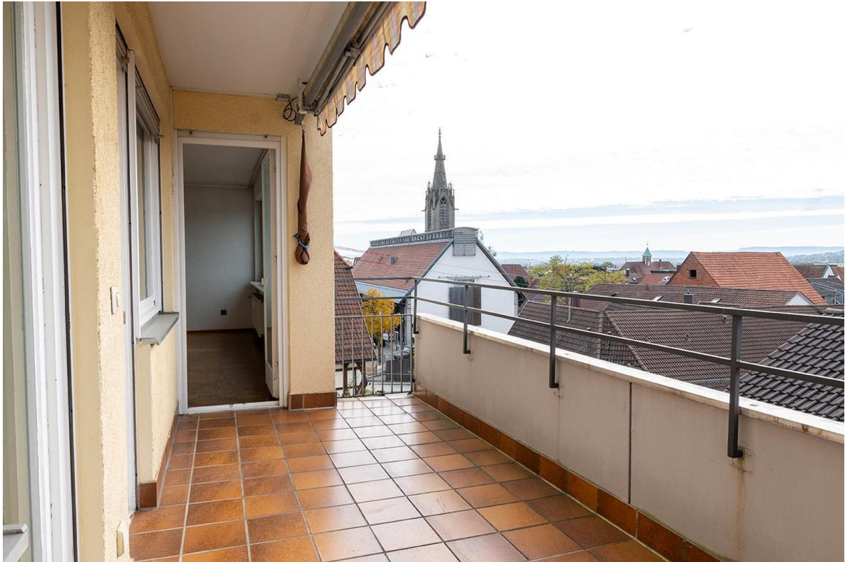
Balkon - Blick über die Stadt