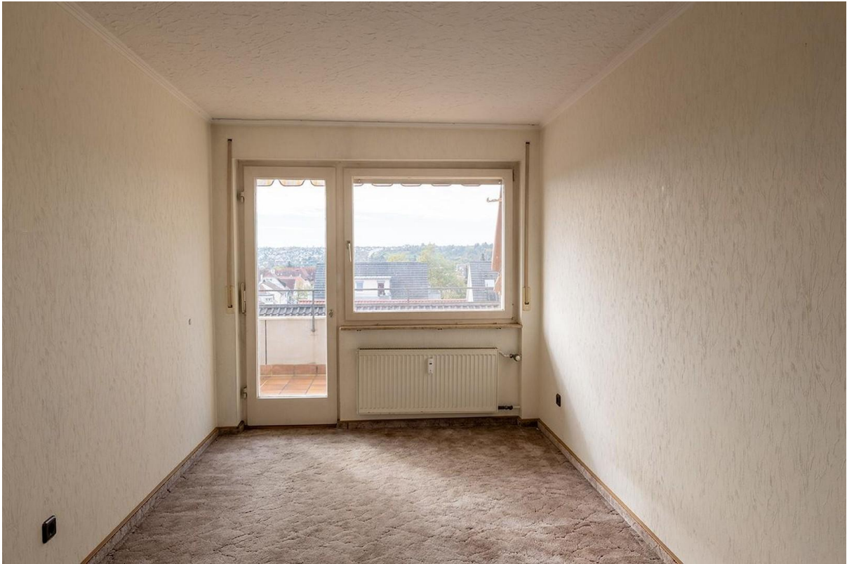
Kinder- oder Arbeitszimmer