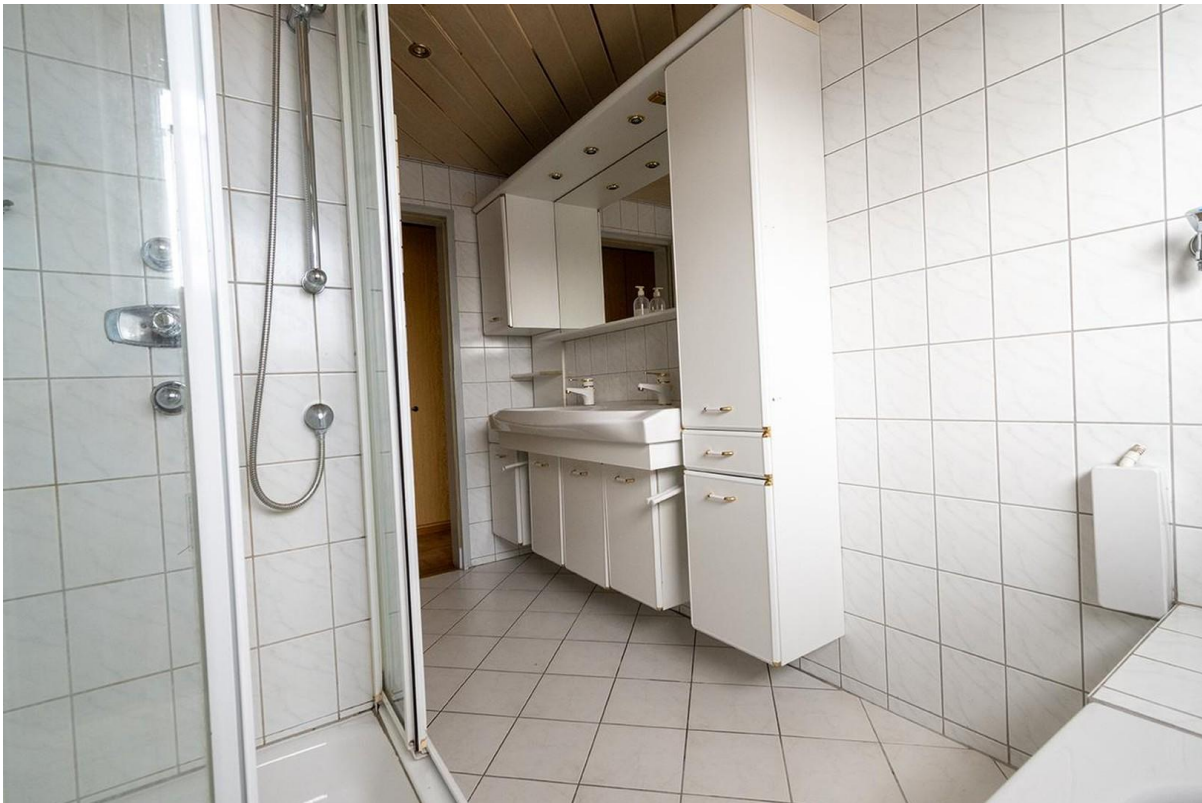
Bad mit Doppelwaschbecken