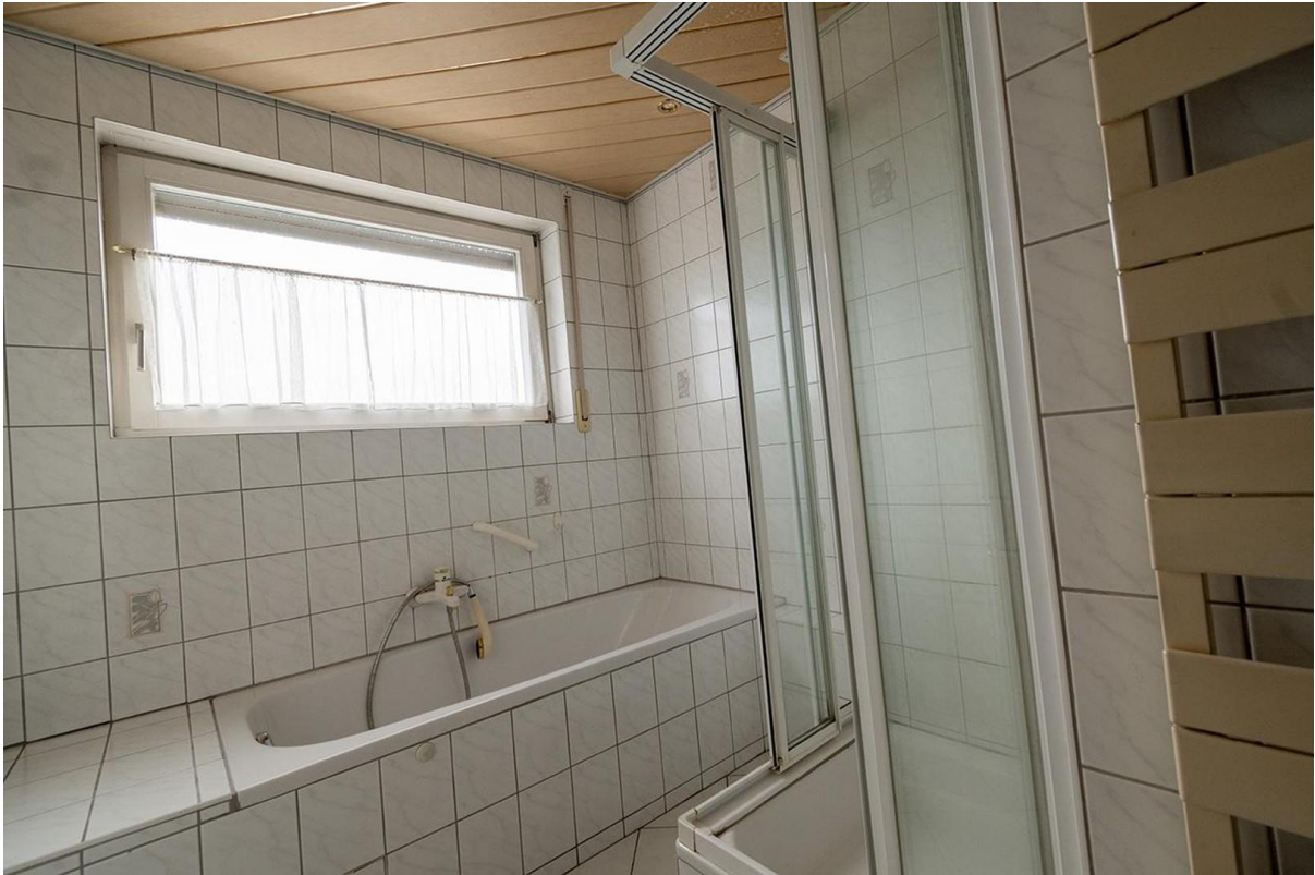
Dusche und Wanne