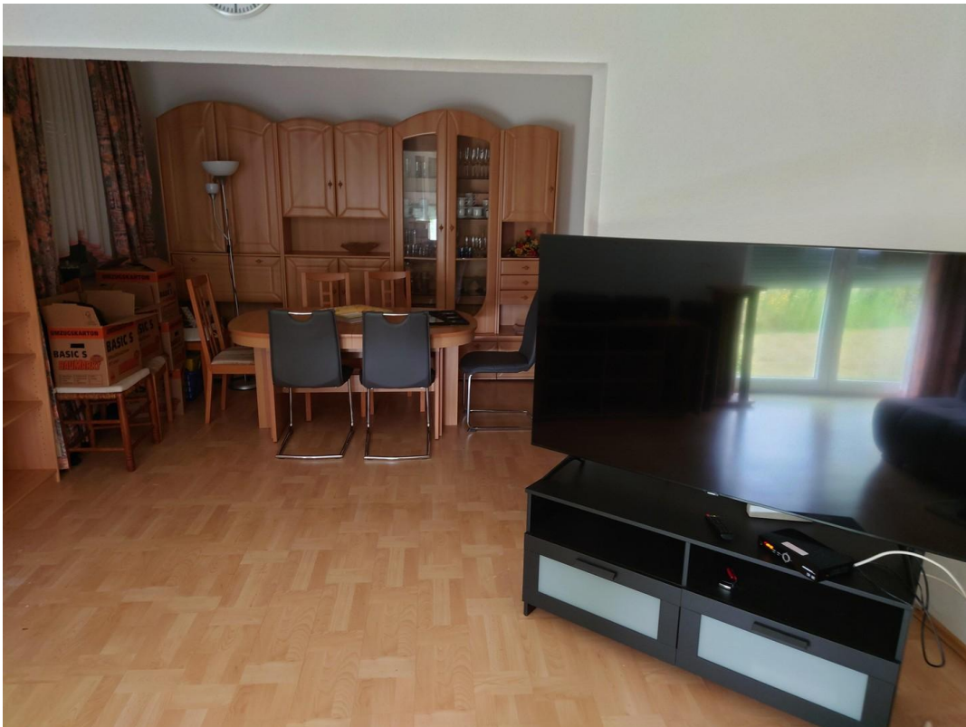
Essecke / Wohnzimmer