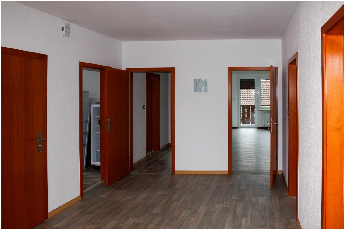
Esszimmer im OG