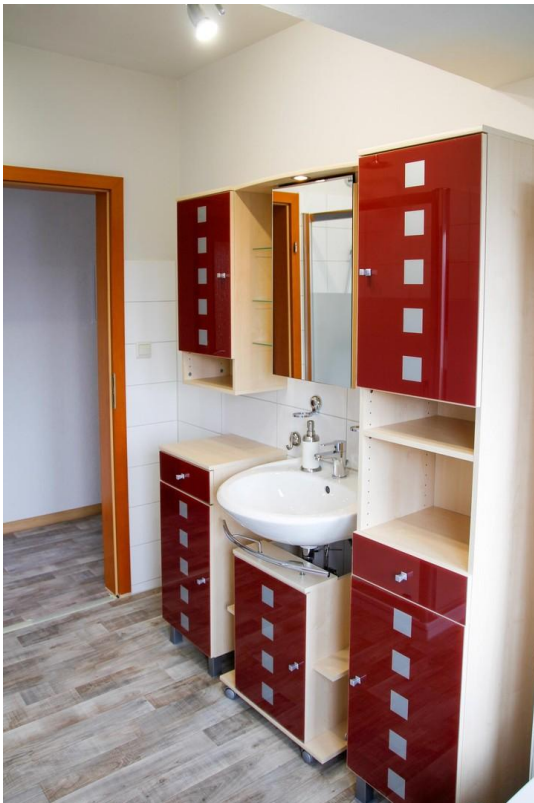
Badezimmer im OG