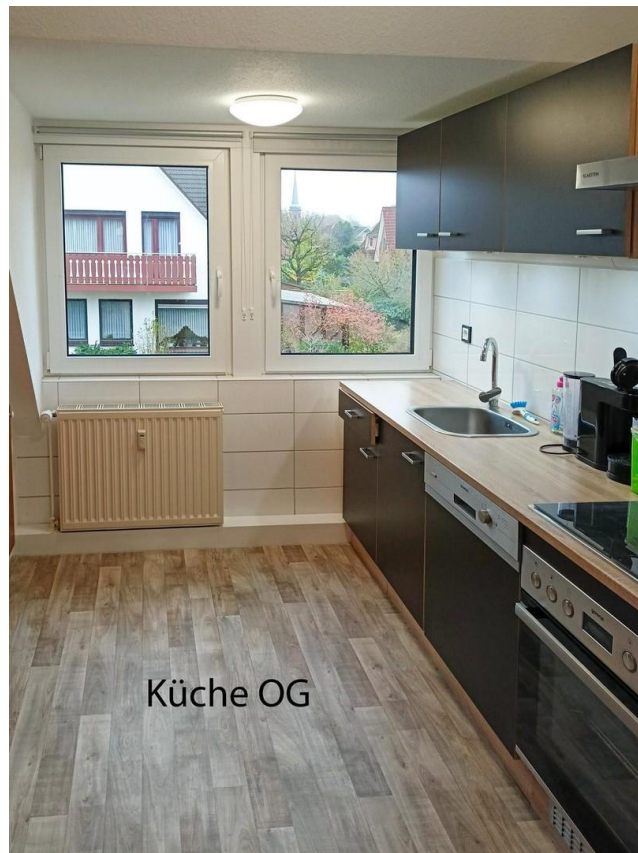
Küche im OG