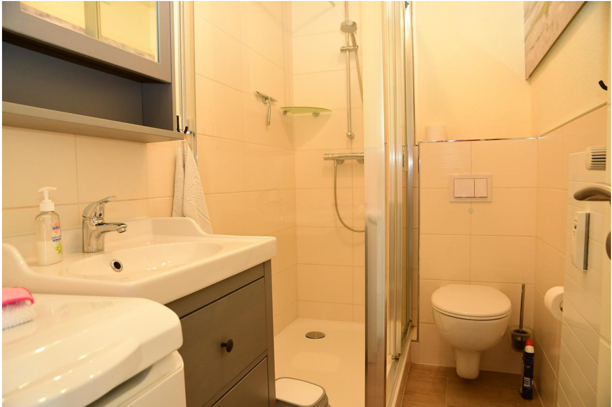
Badezimmer mit tiefer Duschee