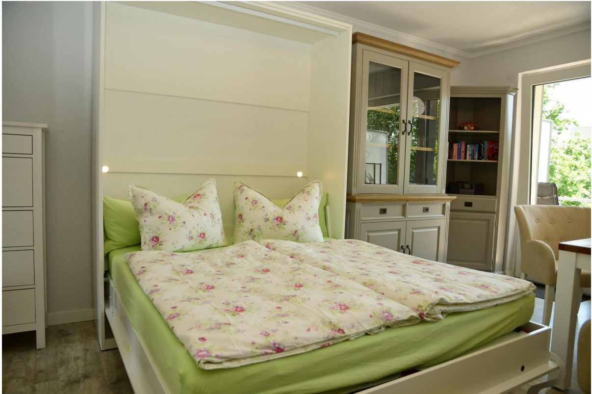
zusätzliches Schrankbett offen