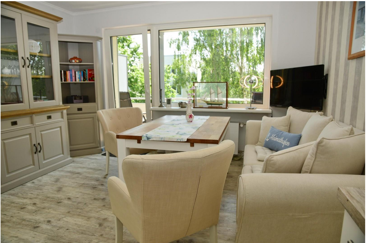
Wohn/Esszimmer mit Balkontür