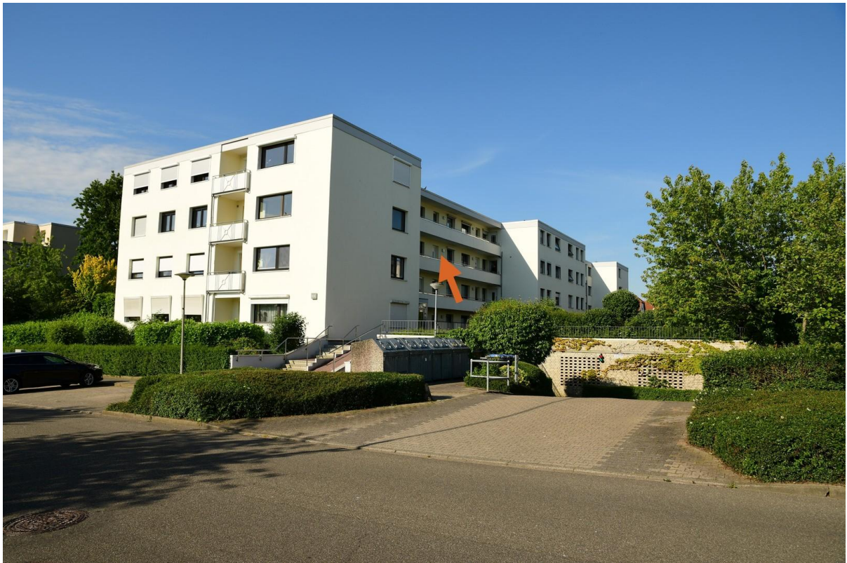
Aussenansicht mit Tiefgarage