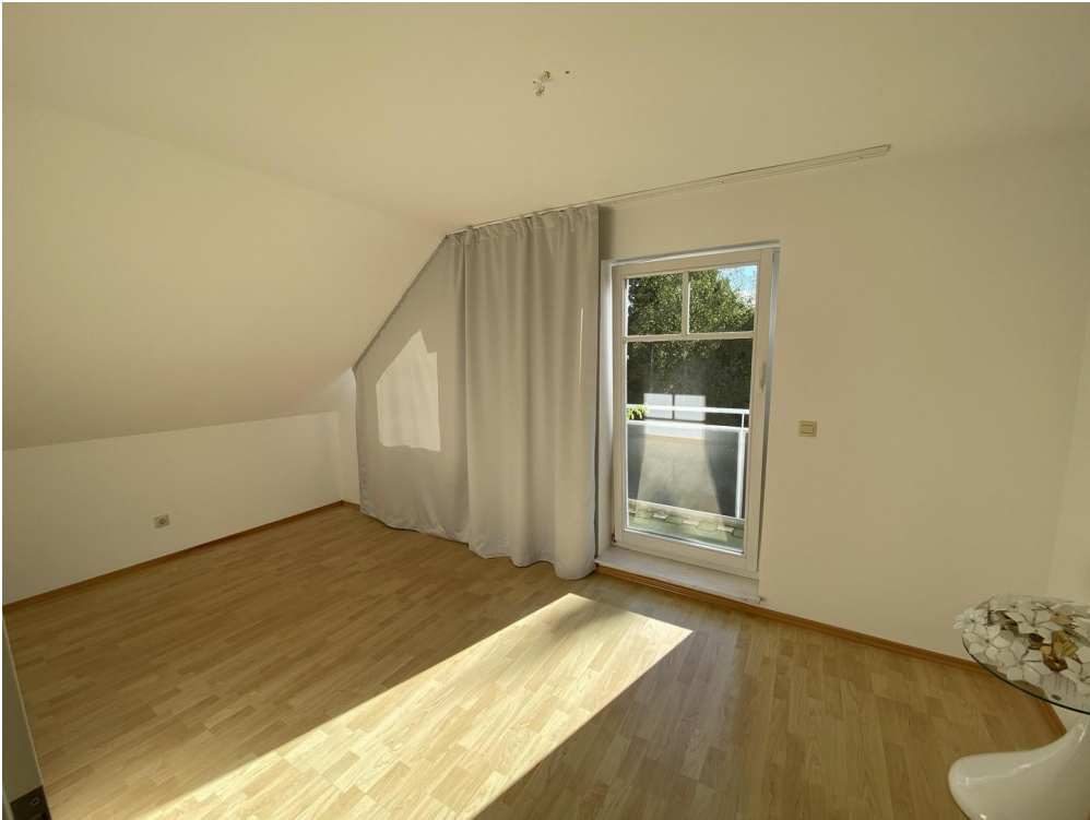
Kinderzimmer oder Büro