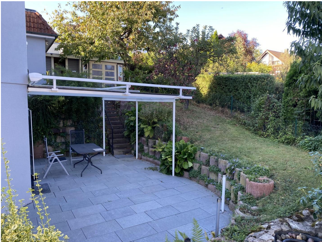
Terrasse und Garten