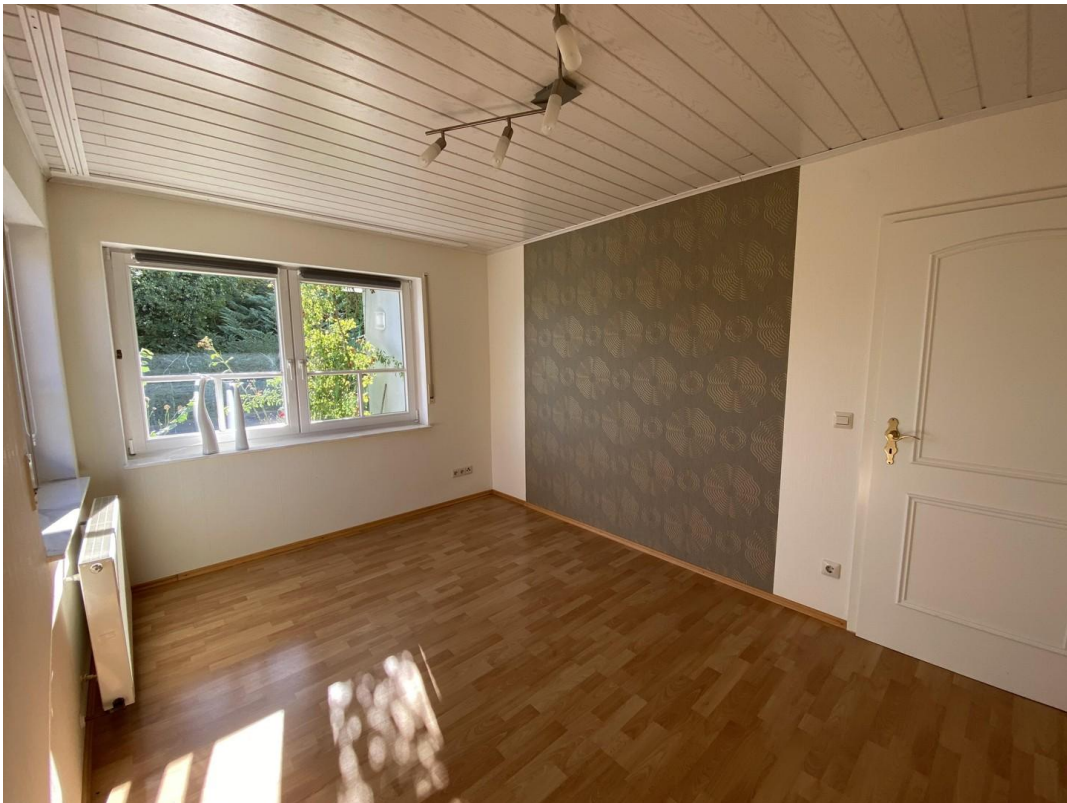
Kinderzimmer oder Büro