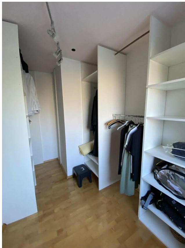
Zugang zur Ankleide