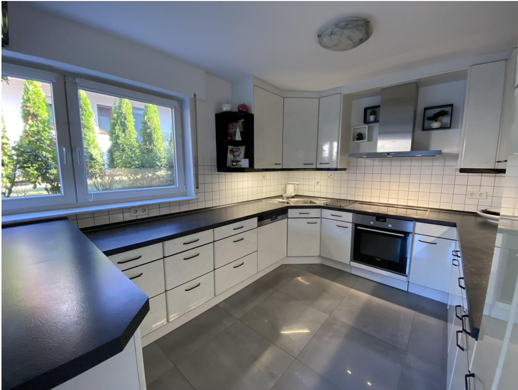
Offene Küche mit Theke