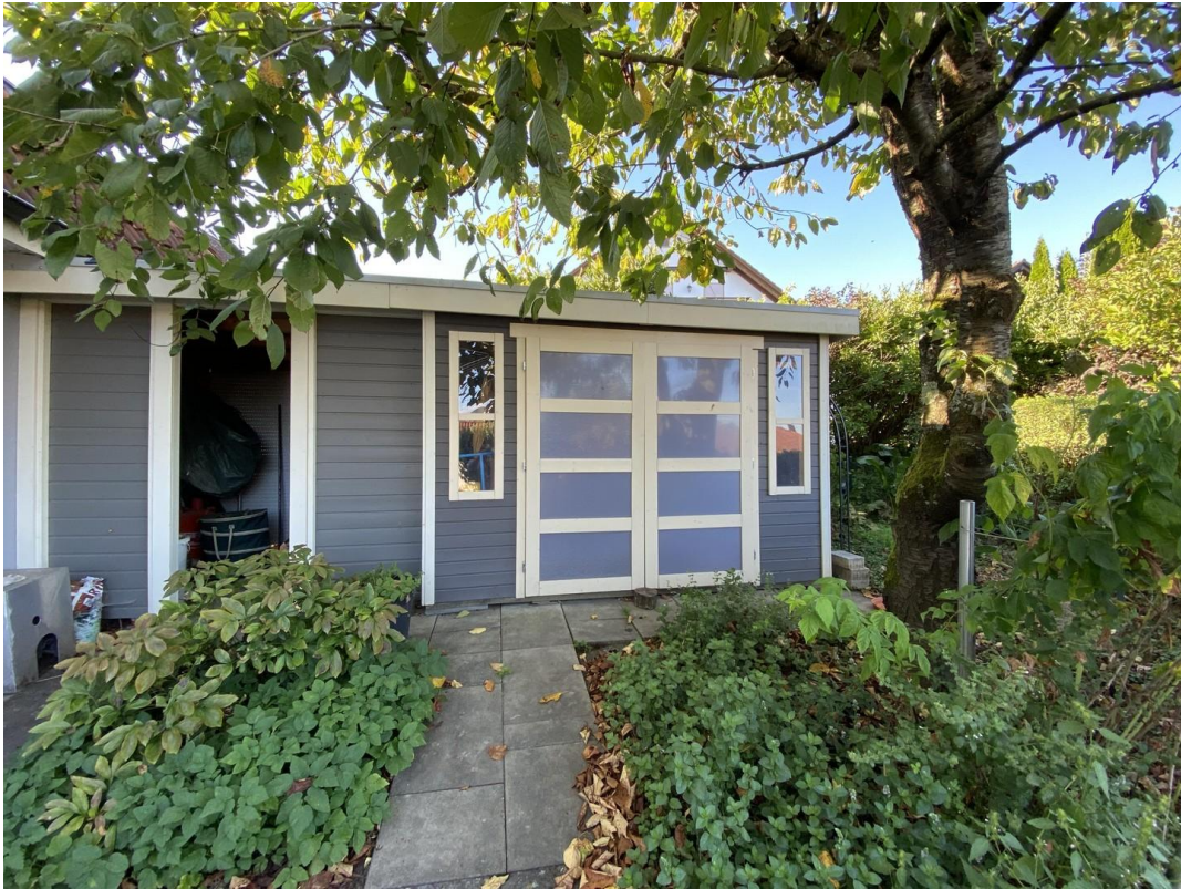
Gartenhaus unterm Kirschbaum