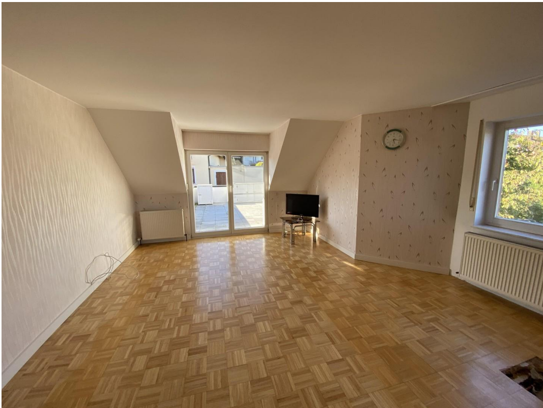
Wohnung, Wohn- und Essbereich