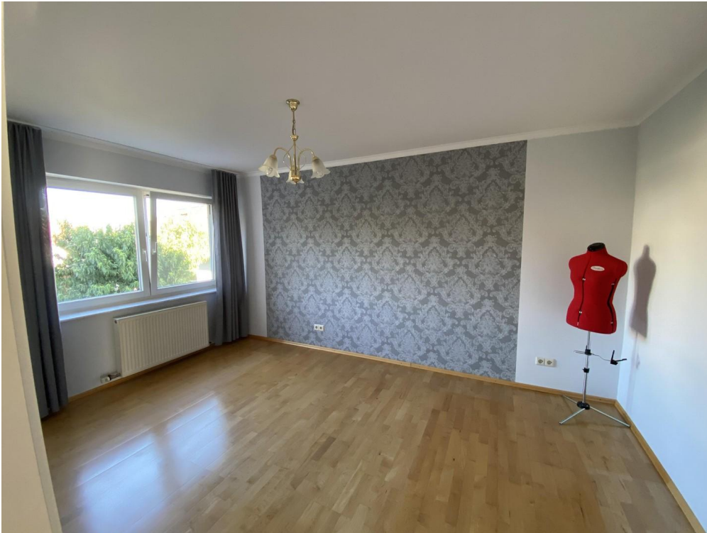
Elternschlafzimmer mit ...