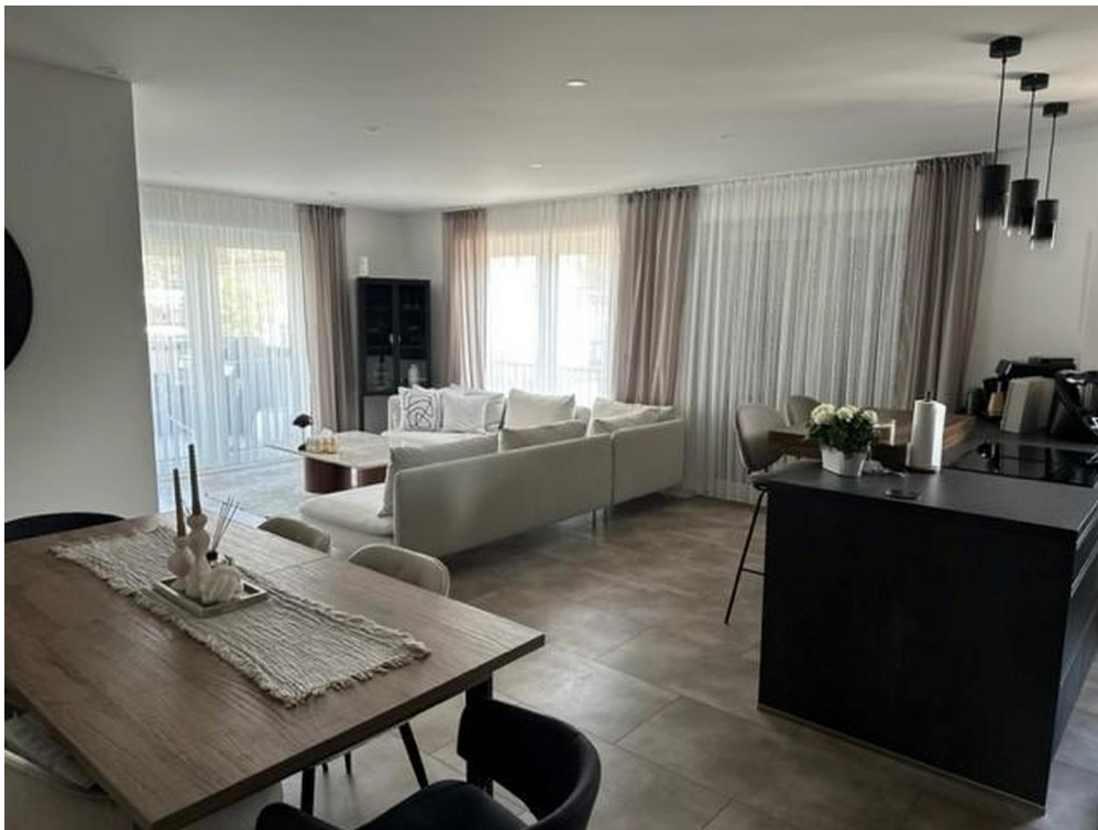
Wohn-, Essbereich, Küche