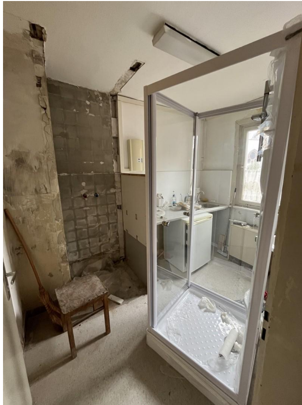
Küche im 1. Stock