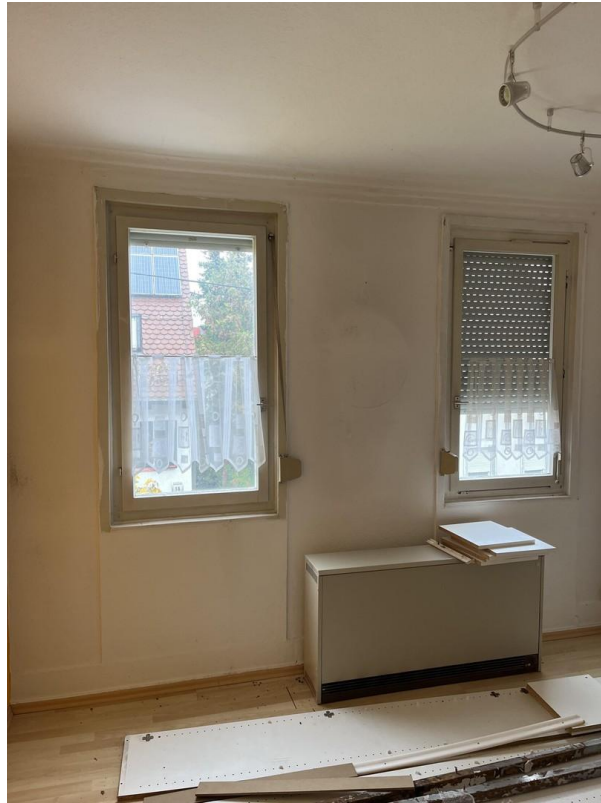
Wohnzimmer im 1. Stock