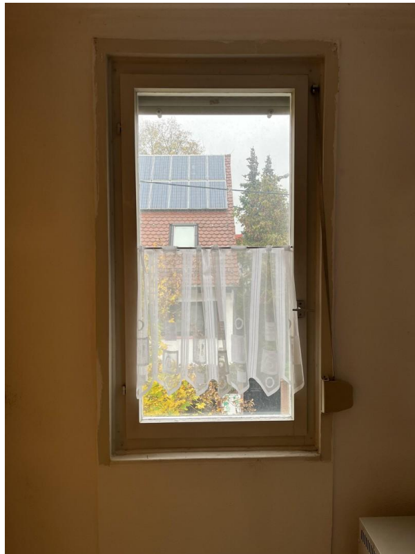
Blick zur Straße