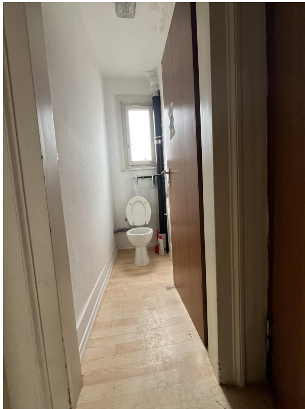
Toilette im 1. Stock