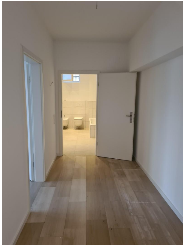
Flur zum Bad