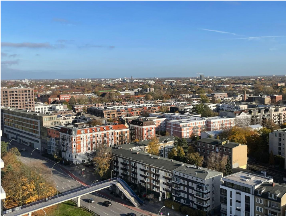
Blick über Hamburg