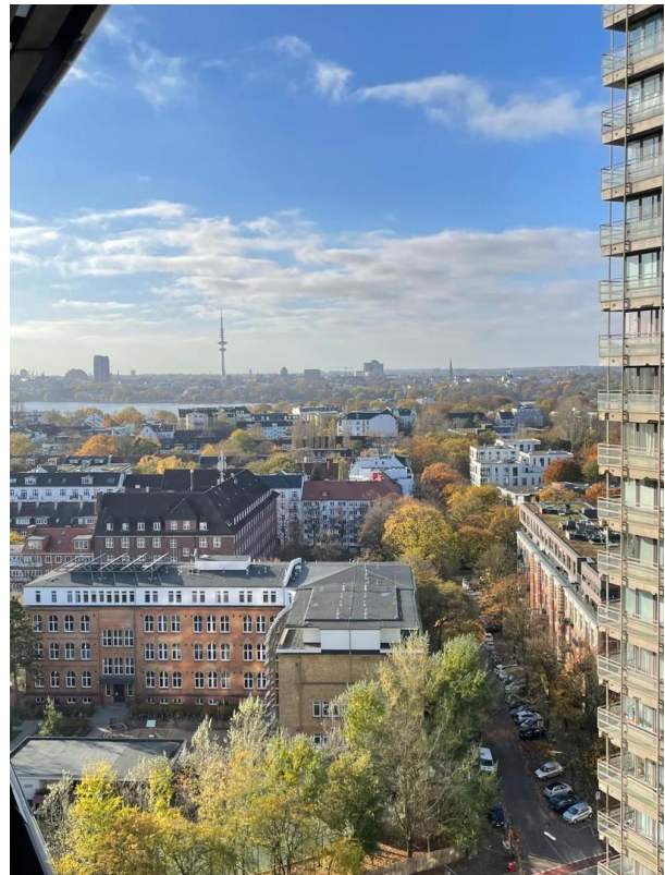
Blick auf den Fernsehturm