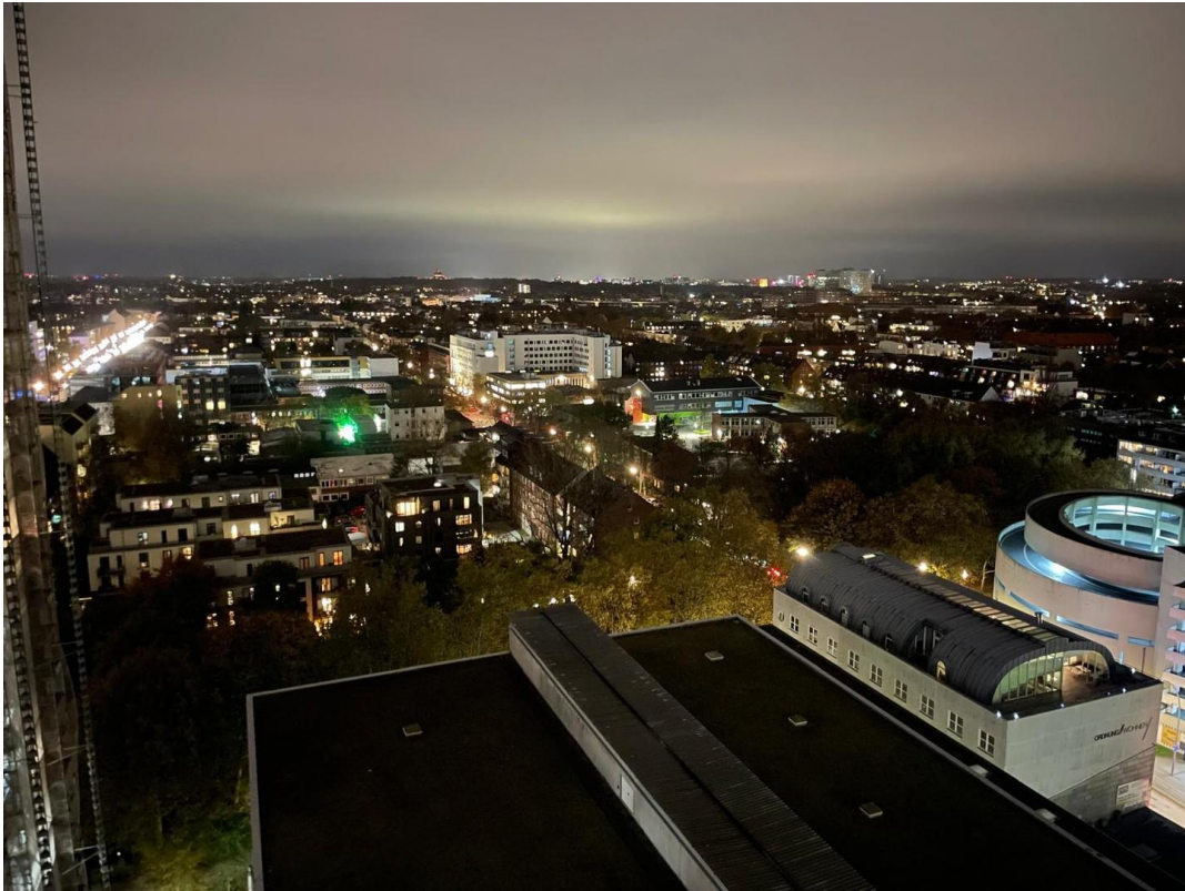
Nacht in Hamburg