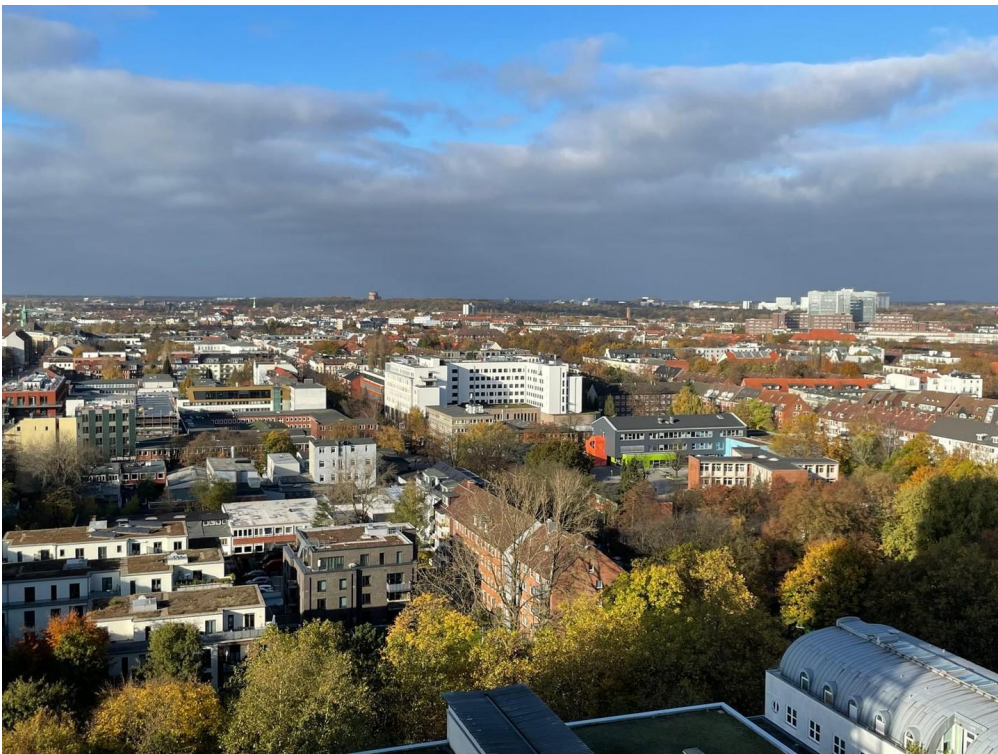
Blick auf den Stadtpark