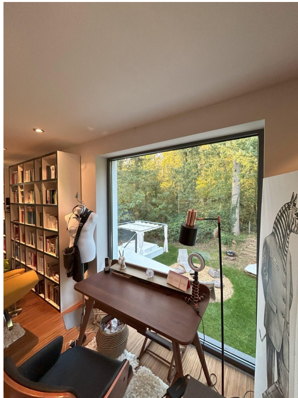
Galerie - Blick in den Garten