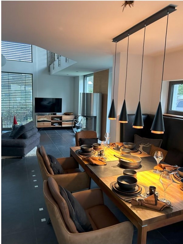
Essen mit Freunden