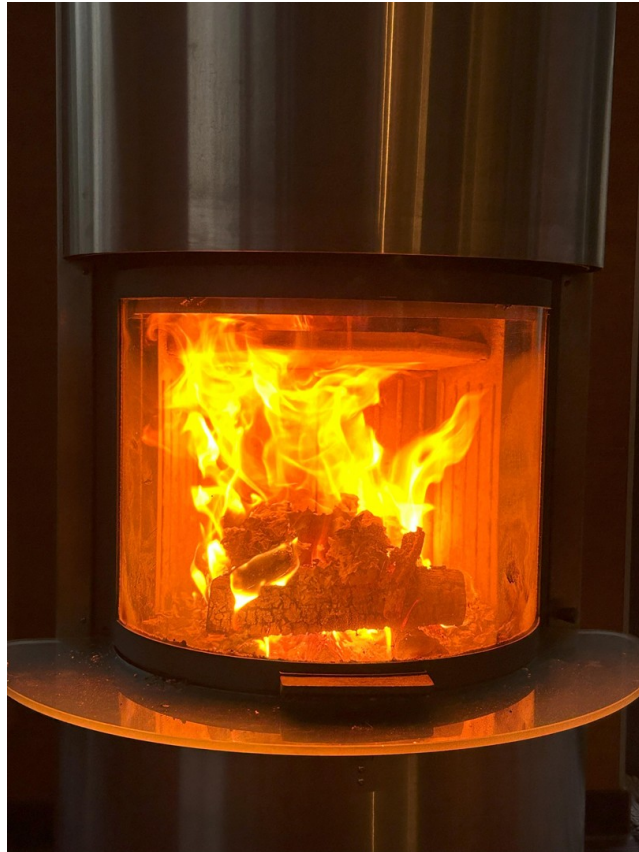
Wärme und Gemütlichkeit