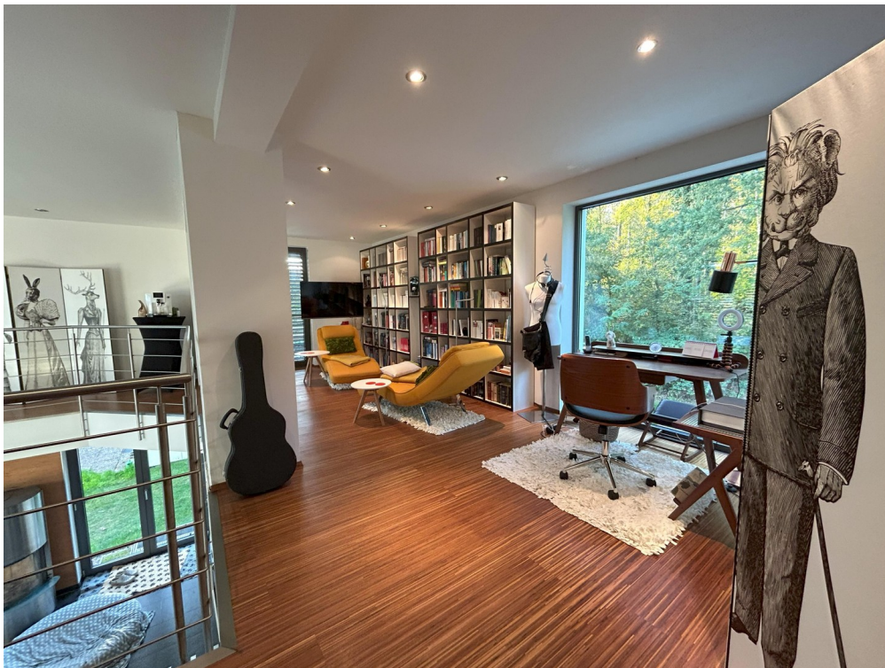
Galerie - Raum zum Leben