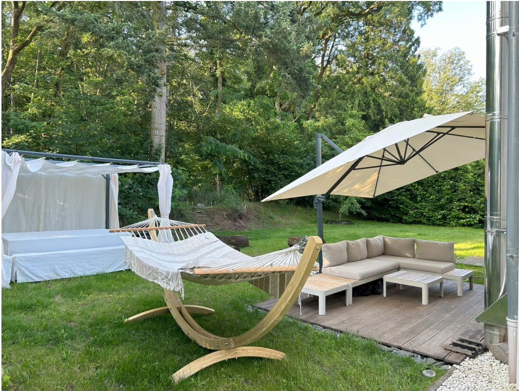
Gartenlust und Waldesruh