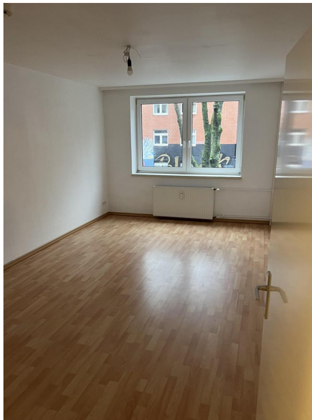
Zimmer 1 Beispielwohnung