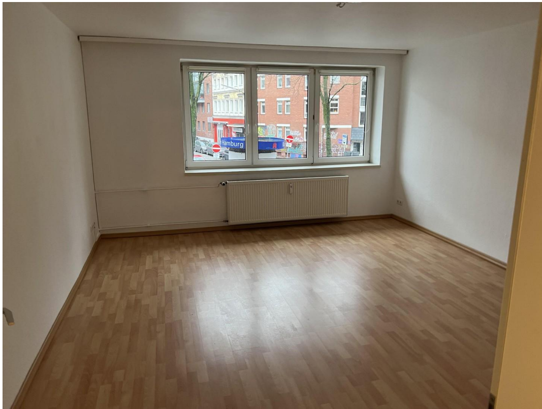
Zimmer 2 Beispielwohnung