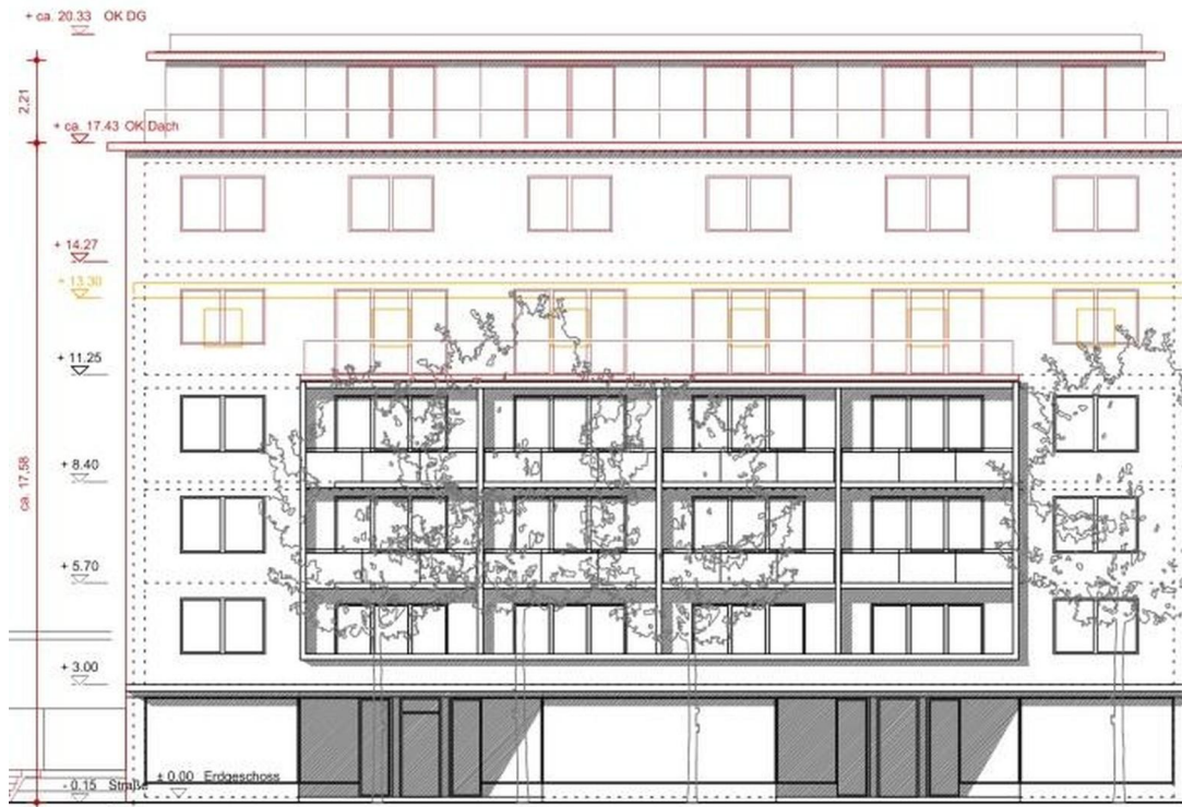
Vorbescheid / Planung