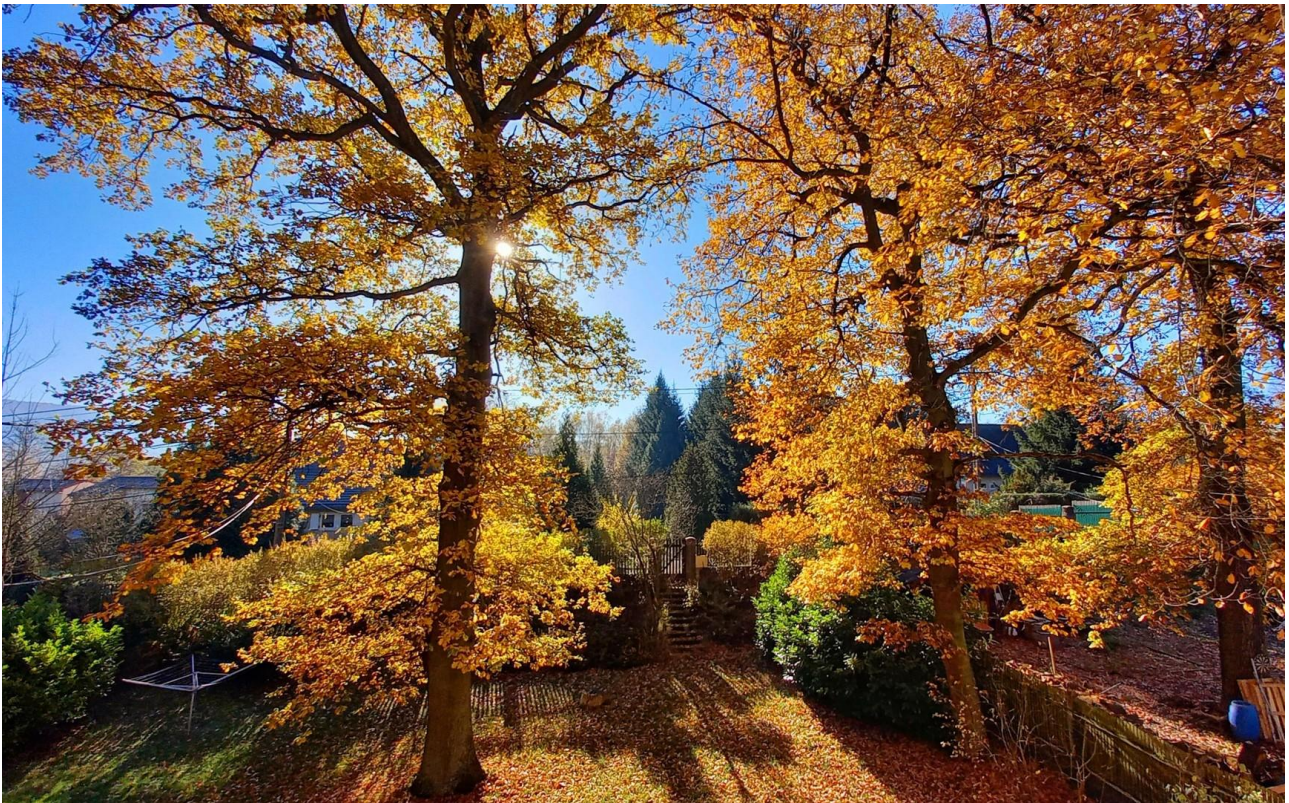
Garten mit altem Baumbestand