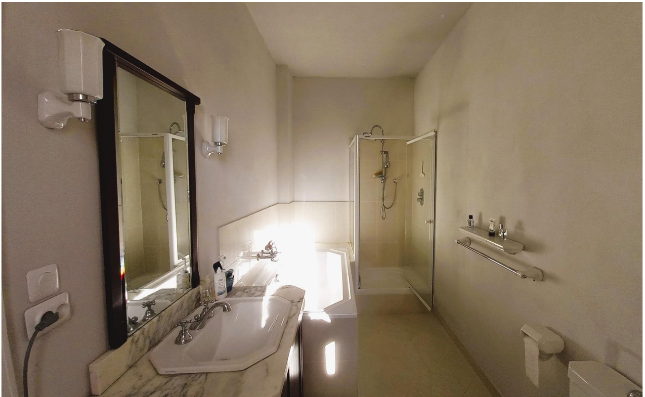
Bad 1. Etage Duravit 1930