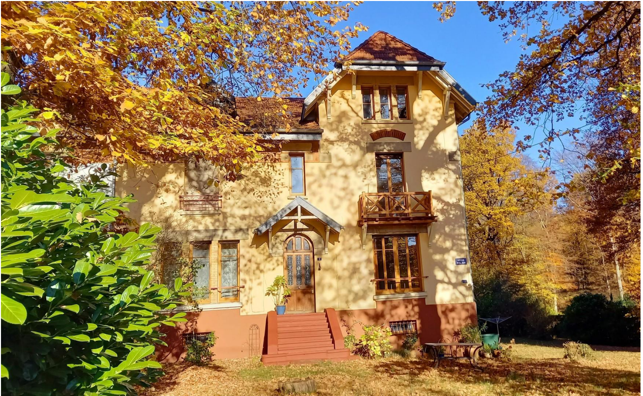
Südseite des Hauses mit Garten