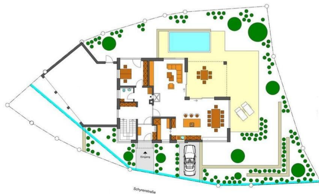
Beispiel 1 Entwurfsplanung