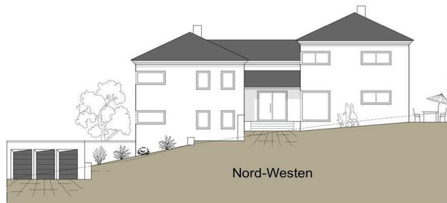
Beispiel 2 Entwurfsplanung