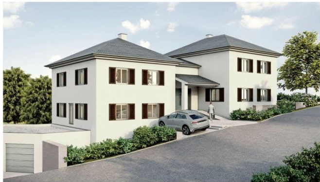
Beispiel 2 Entwurfsplanung