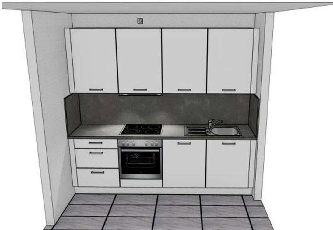
Küche (seit 2021 installiert)