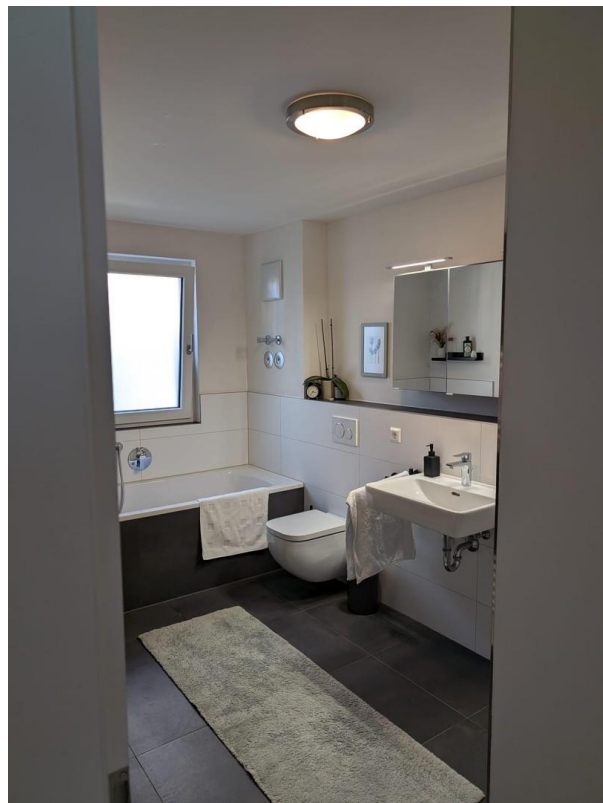
Bad - Badewanne