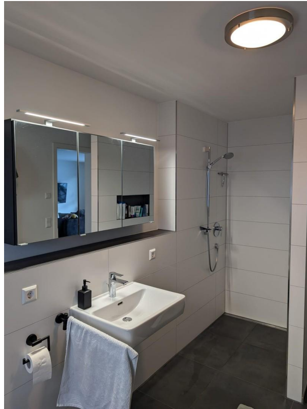
Bad - Dusche