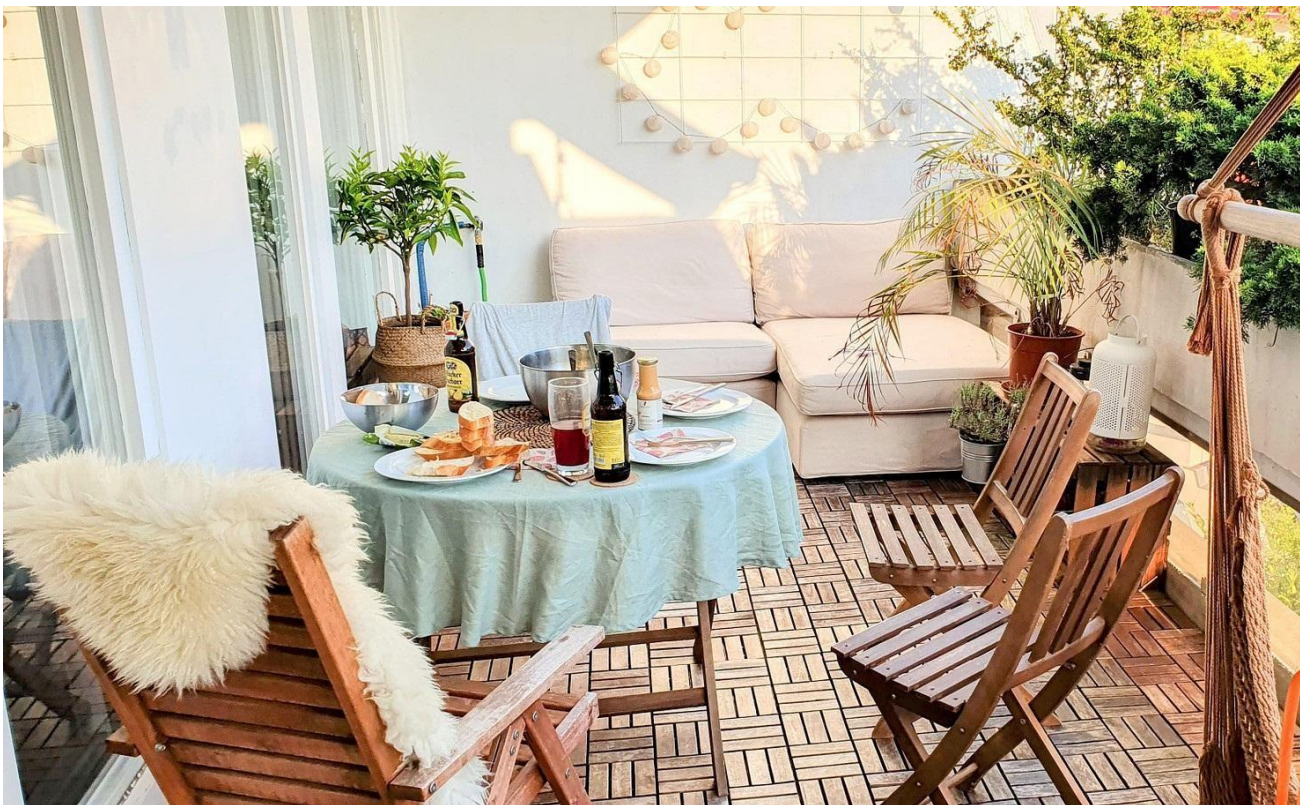
Balkon / Terrasse