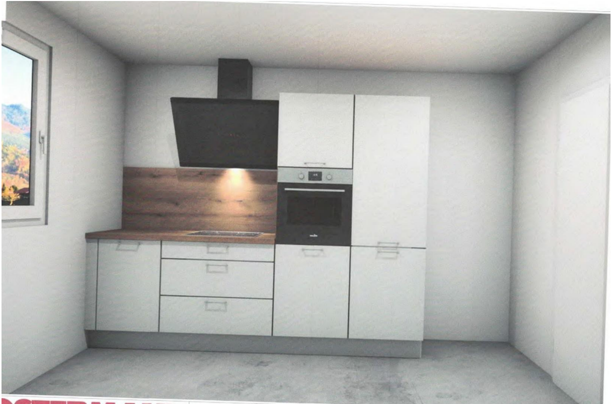
Ansicht Küche rechte Seite