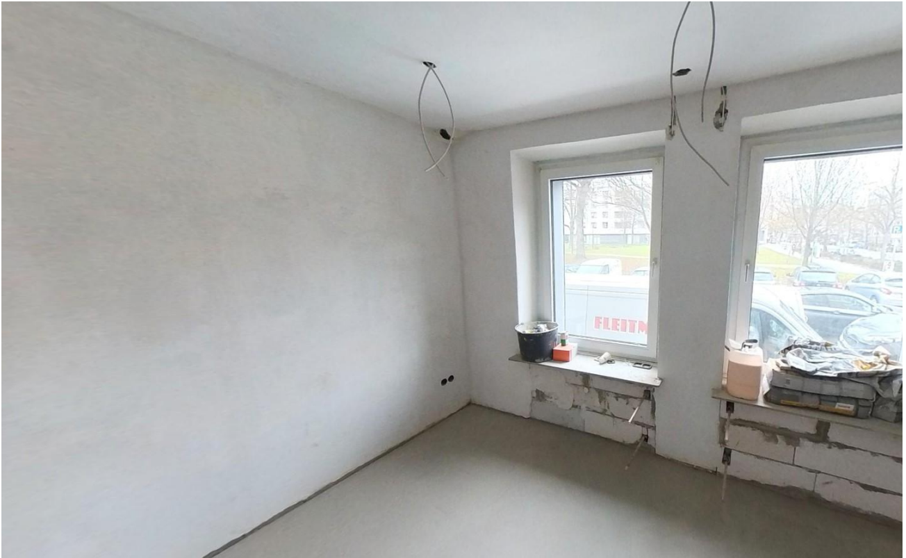
Kinderzimmer / Arbeitszimmer