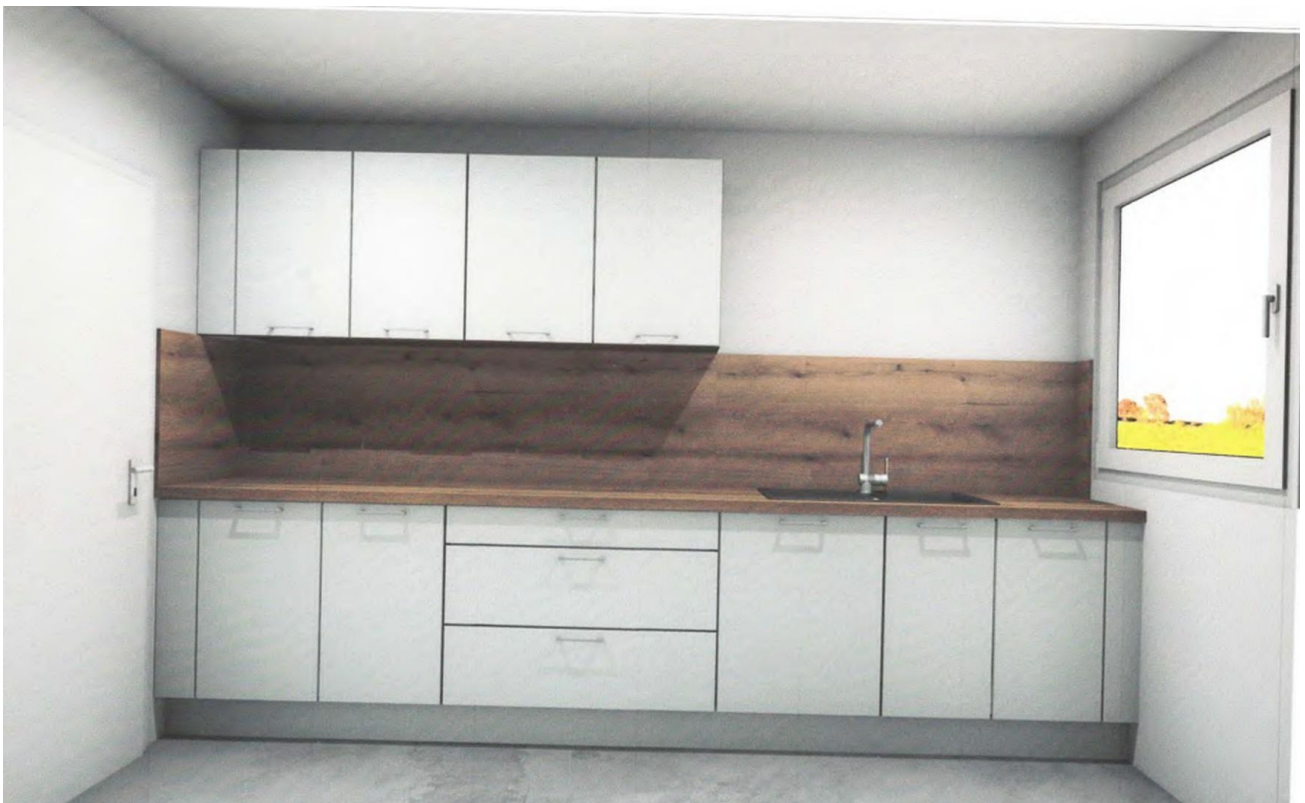
Ansicht Küche linke Seite