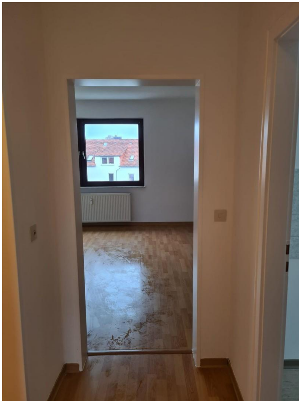
Blick vom Flur in Zimmer 1