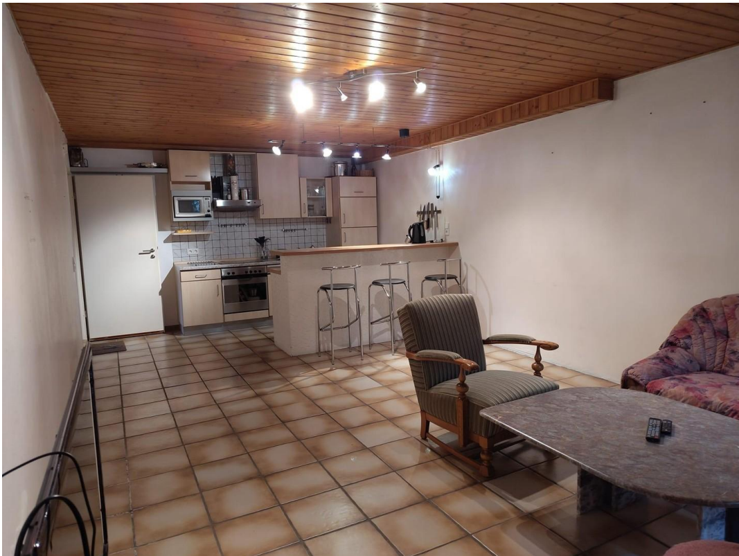
Kochen, Essen Wohnen im KG