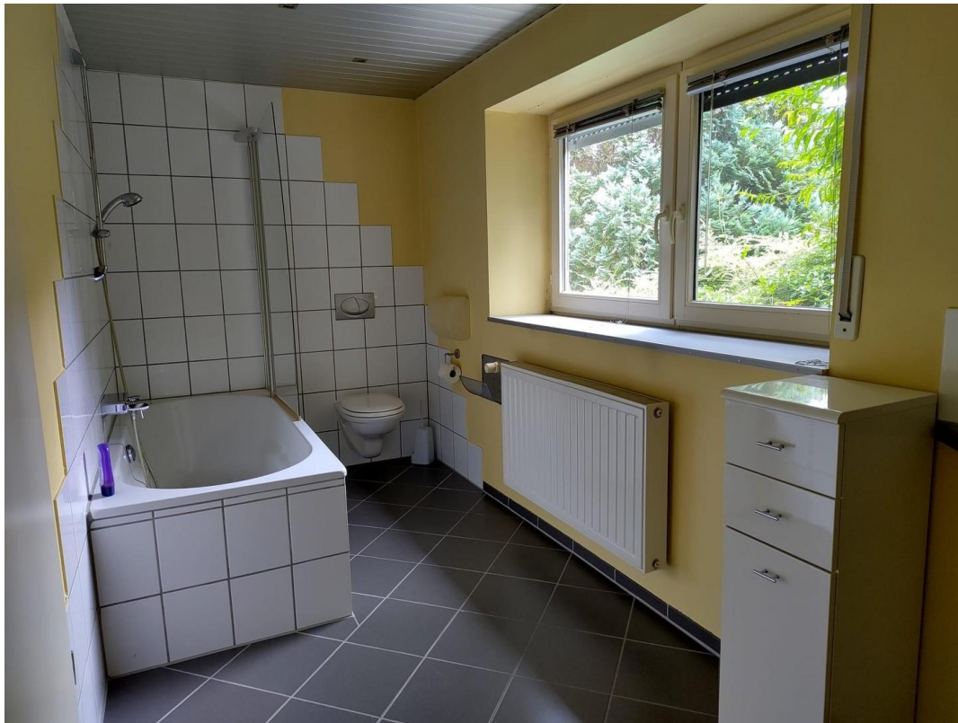
Bad im KG