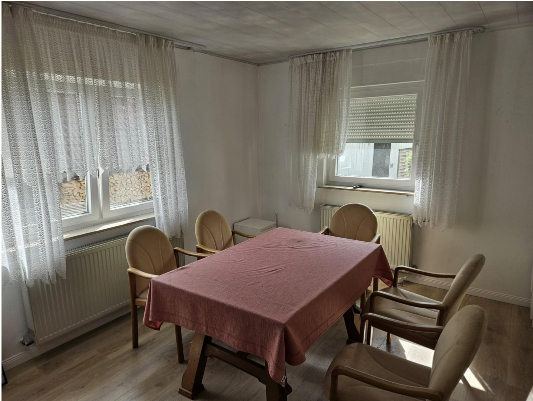
Essen / Aufenthalt